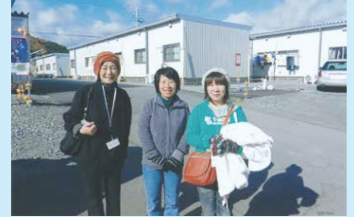
代表 保本が東日本被災地を訪れた際のスナップから。