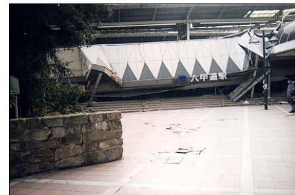
崩れた六甲道駅

あのとき何が起こったのか、神戸大学はどうだったのか、年表や統計データなどでご紹介します。当時とその後の復興の様子を比較していただく写真として、六甲周辺の当時と5年後の航空写真や、附属図書館の当時と今の写真を展示していますので、実際の場所を思い浮かべながらご覧いただければと思います。