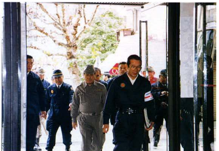
▲野中自治大臣、警備本部を激励のため来訪（生田庁舎）