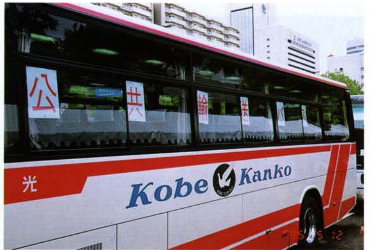
▲ポートルライナー代替の輸送バス（中央区）