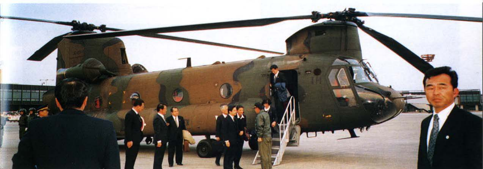
▲大阪国際空港に御到着の皇太子同妃両殿下