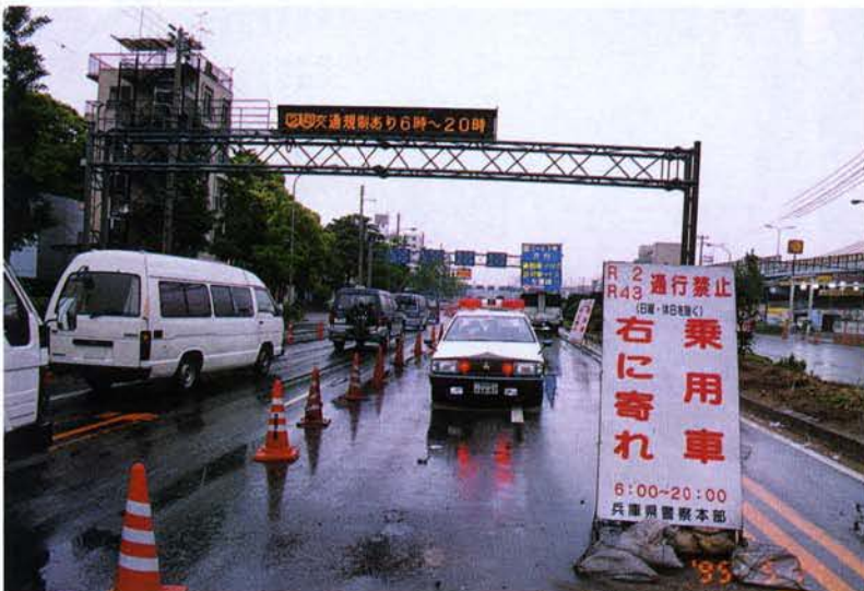
◀ 交通規制を表示する電光掲示板（中央区）