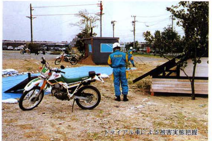
トライアル車による被害実態把握