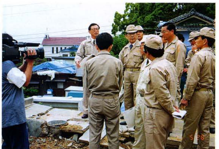
▲野坂建設大臣の被災地視察（須磨区） 91