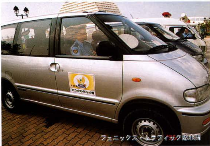
フェニックス・トラフィック隊車両