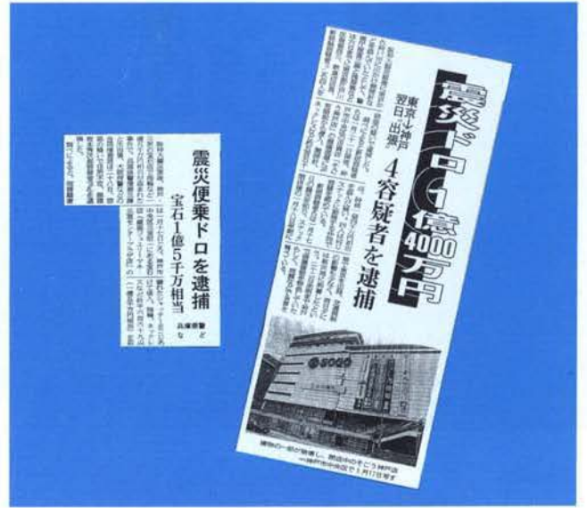
▲宝石窃盗団の検挙を伝える新聞記事 (左から)3月29日付神戸新聞、3月7日付毎日新聞