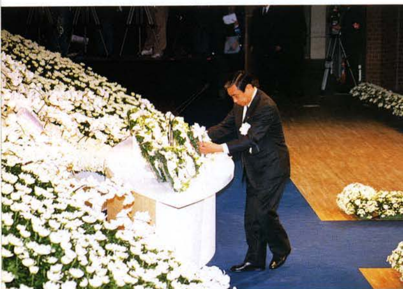
▲河野外務大臣の献花（神戸文化ホール）