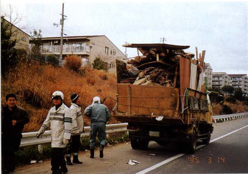
▲積載超過取締り（須磨区）