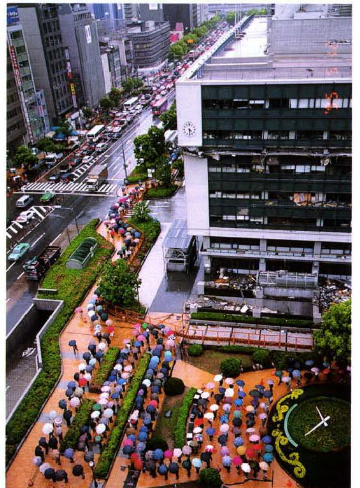
▲長蛇の列：ポートルライナー代替バス市役所前乗場（中央区） 77