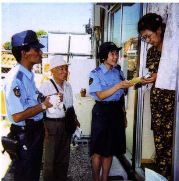
▲仮設住宅の独居高齢者に防犯ベルを配付する西宮警察署員