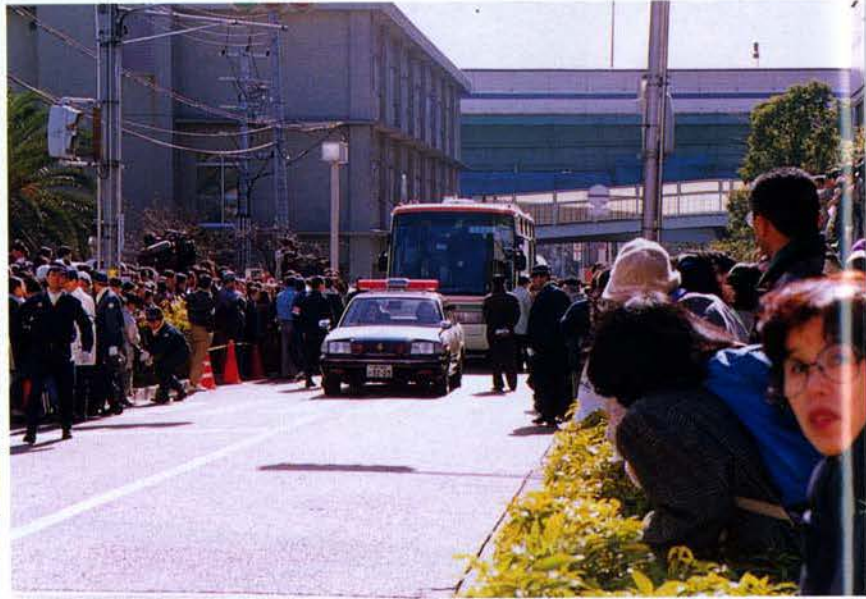
▲お召車を先導するパトカー（芦屋市）