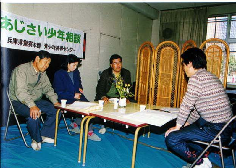
▲本部分少年課と青少年補導センター合同での「あじさい少年相談所」開設