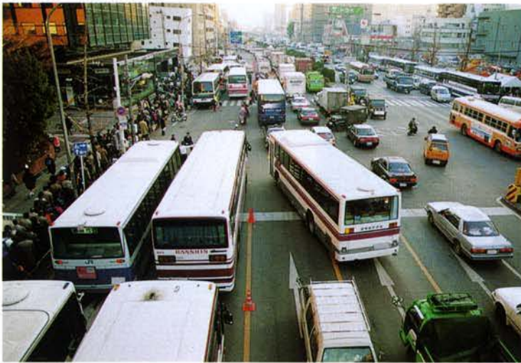
▲JR三宮駅前、通勤客・バスで混乱（中央区）