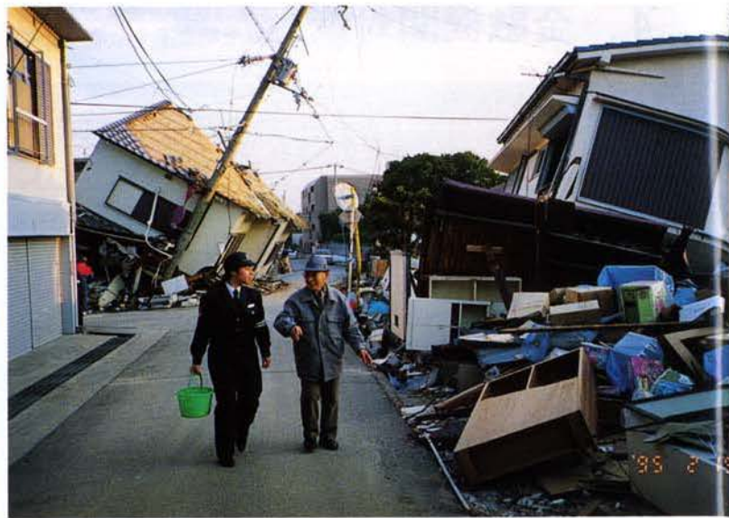
▲被災者とのふれあい（芦屋市）