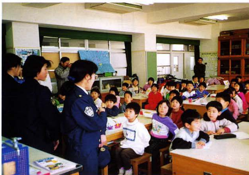
▲小学校を訪問中の隊員(須磨区)