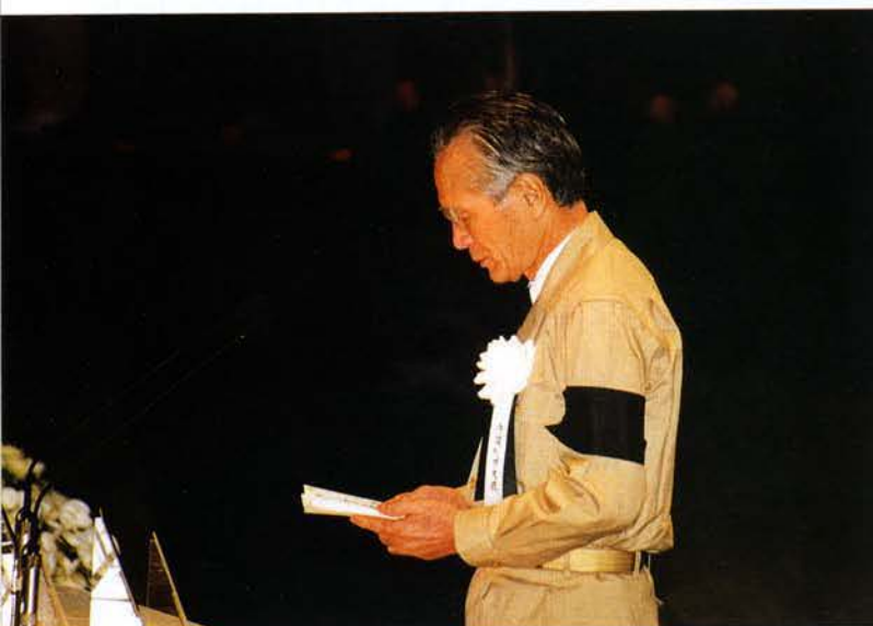
▲村山総理大臣の弔辞（神戸文化ホール）