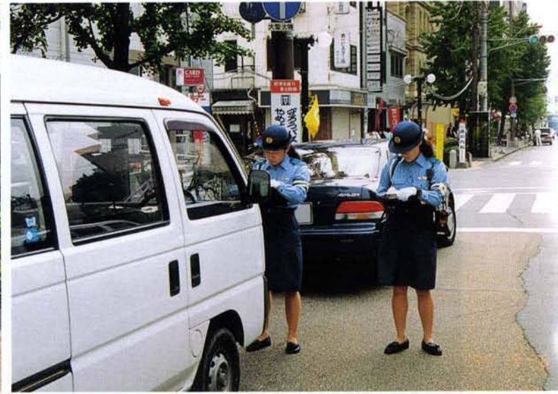
◆不法駐車がなくなる幹線道路では、厳しい取締りを行なう（中央区）◆