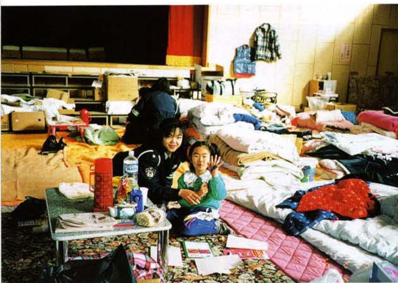
▲各避難所を訪問（宝塚市）