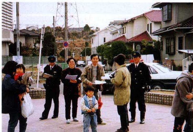
←生活関連要望も聴取（須磨区）