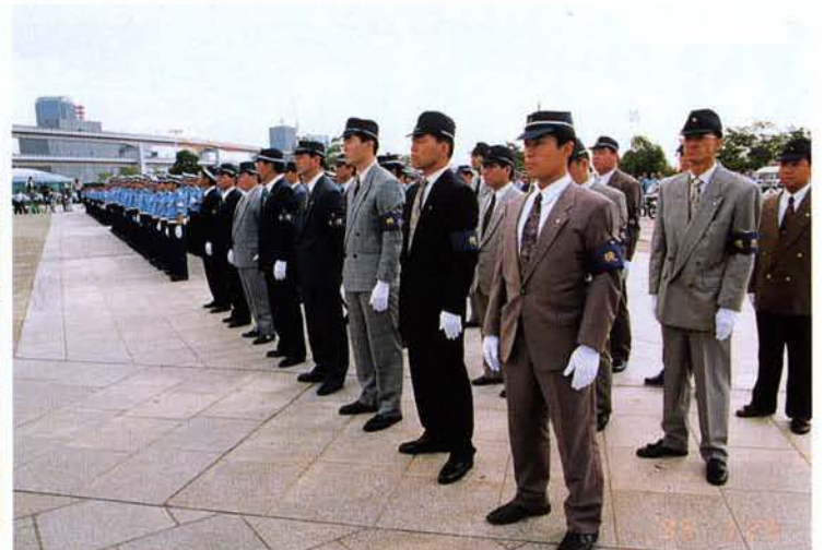
▲発隊式に整列したフェニックス隊▲