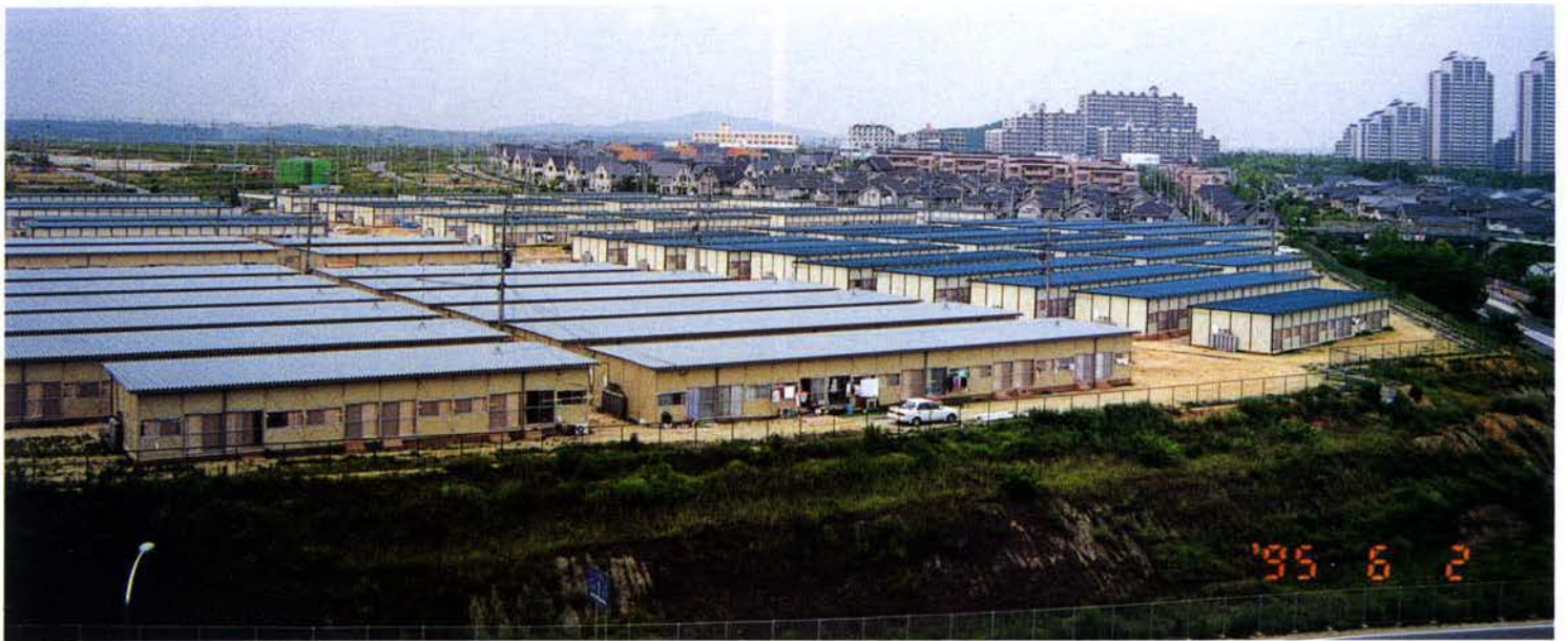
▲神戸市西区春日台