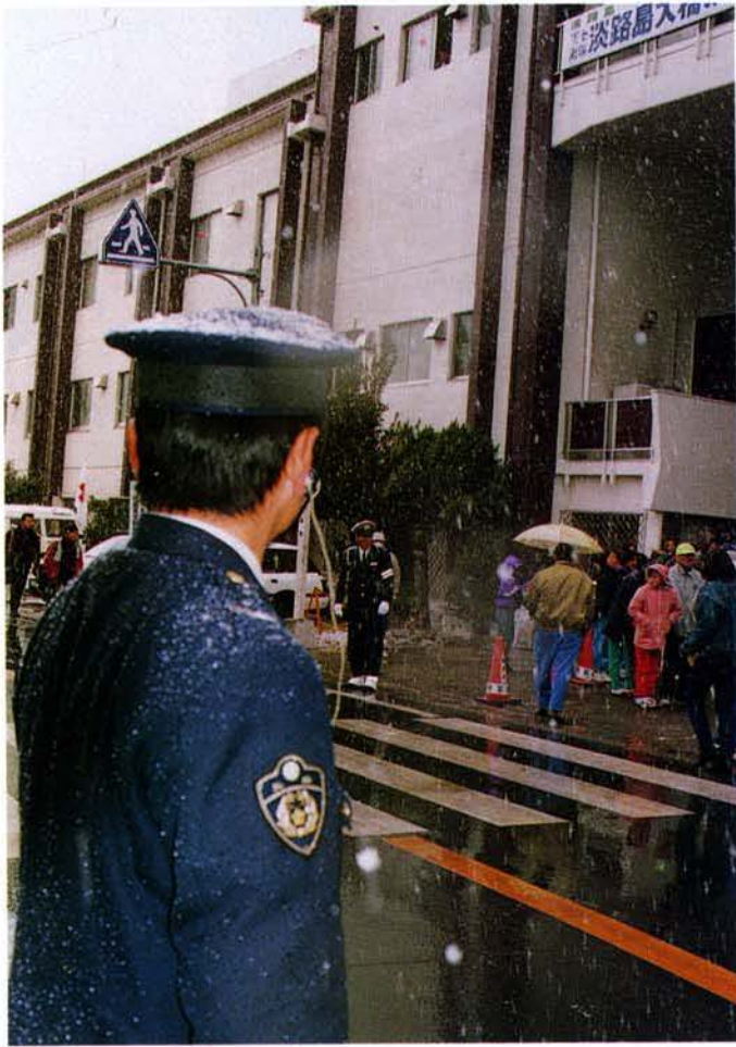
▲雪の中での沿道整理（北淡町）