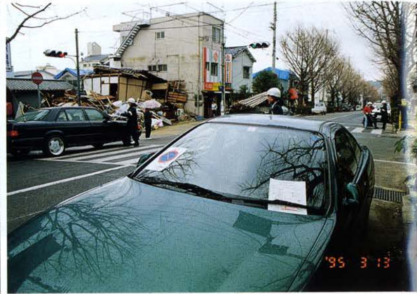
▲灘区内で取締りに従事するひまわり隊員 ▼