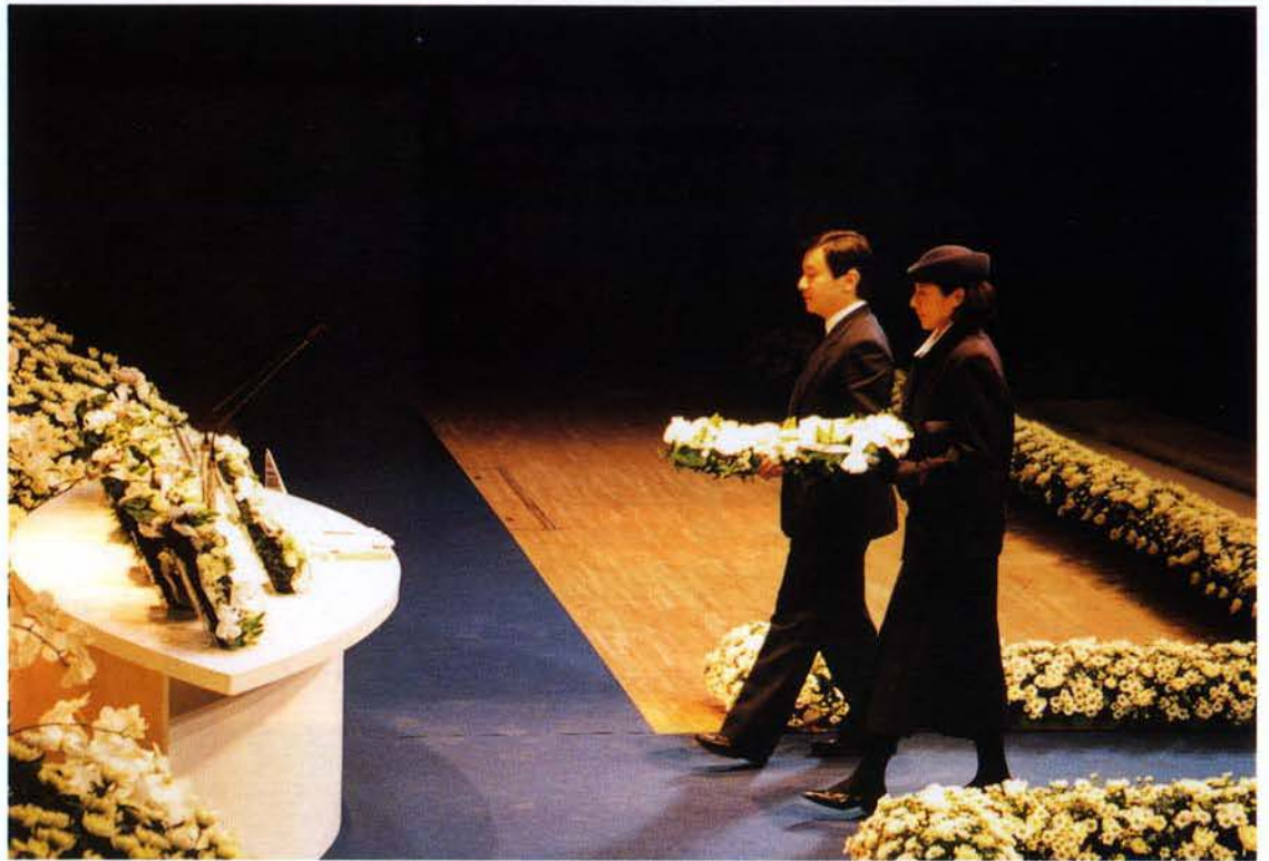
神戸文化ホールにおける 皇太子同妃両殿下による献花 (中央区・3月5日) ▶

犠牲者の霊を慰めるため被災各市町では、皇太子同妃両殿下をはじめとした多くの参列者のもとに慰霊祭が行われた