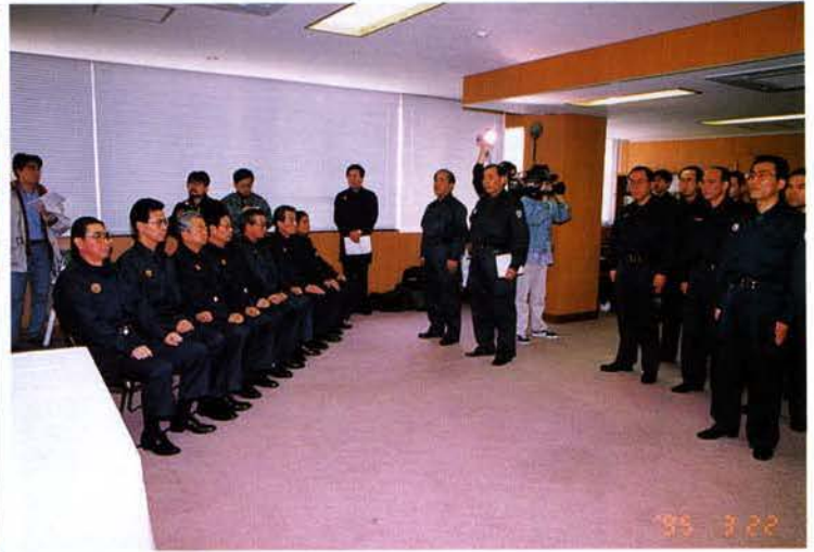
▲警備部幹部と災害対策課員