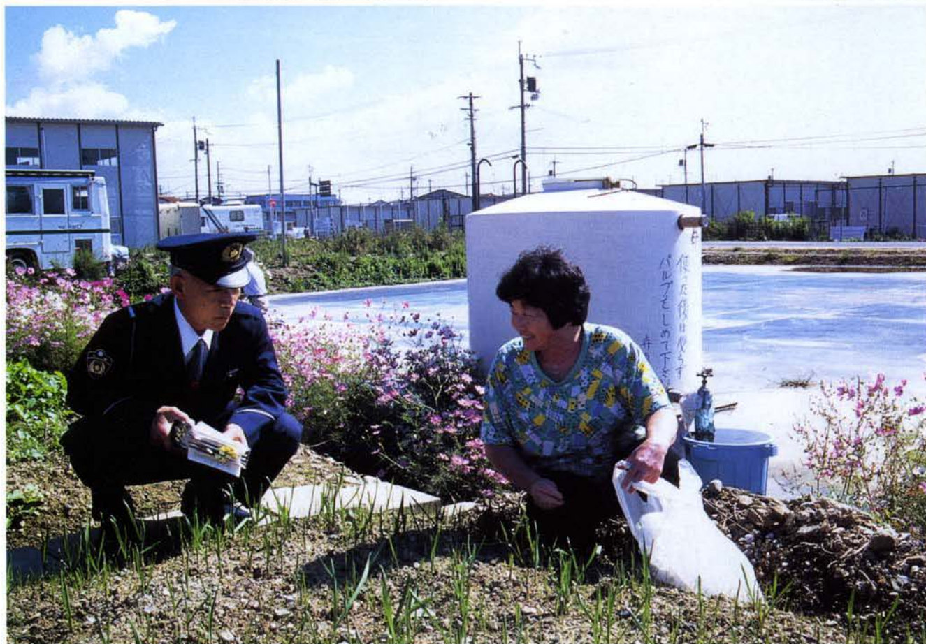
▲ 仮設住宅を巡回連絡中の加古川警察署員（加古川市）