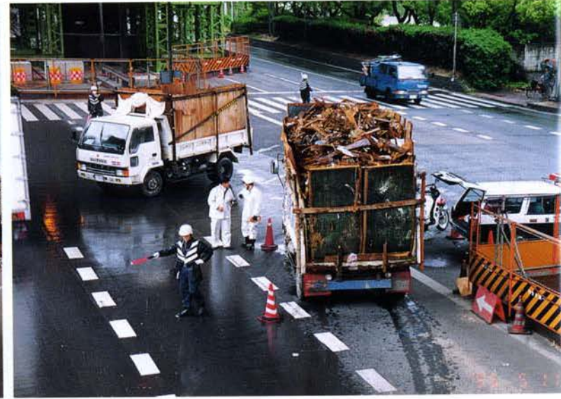
▲積載超過取締り（西宮市）