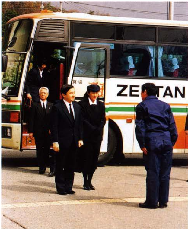
▲宝塚市市民会館 (3月5日)