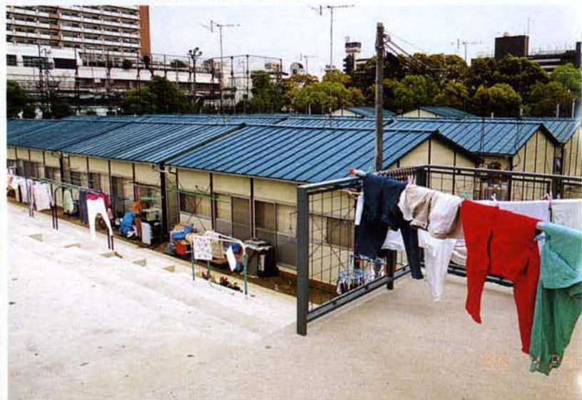
▲ 入居済みの仮設住宅（長田区）