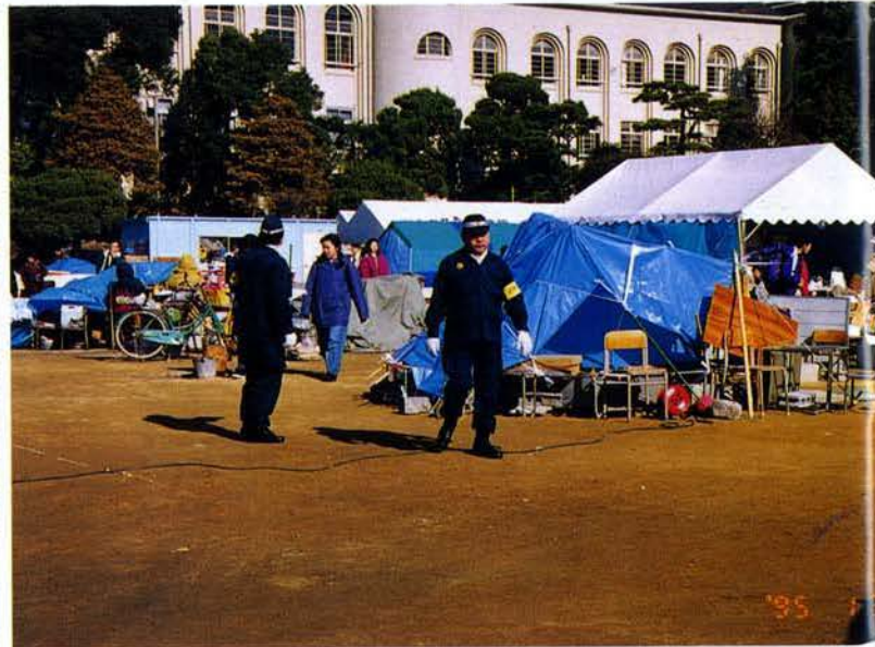
▲立寄り先や通過場所の警戒・整理活動▲