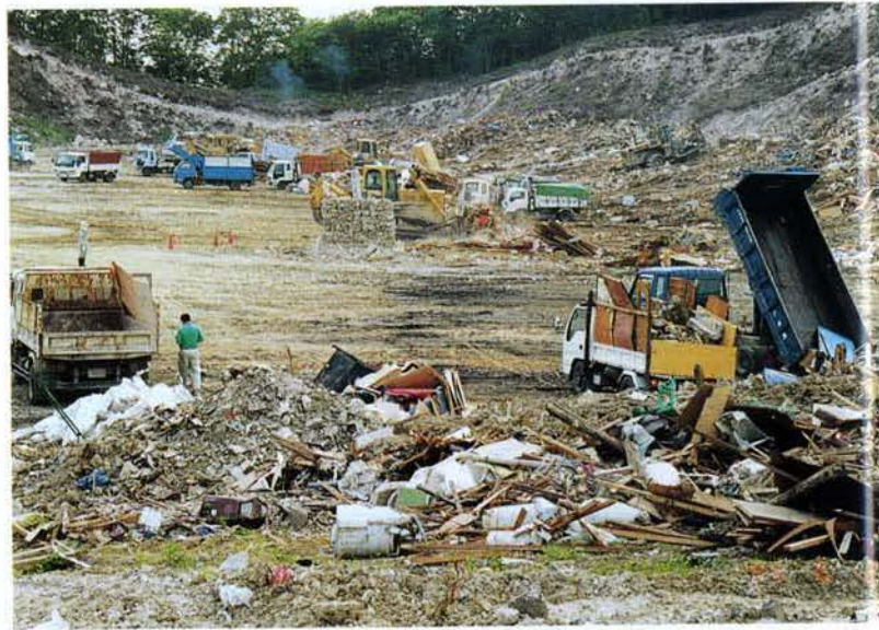
▲搬入された廃材（須磨区多井畑処理場）