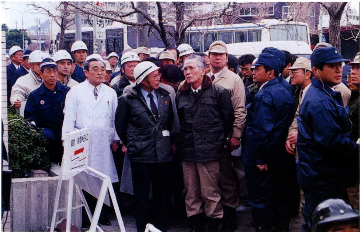
▲神戸市立西市民病院を視察する村山総理大臣