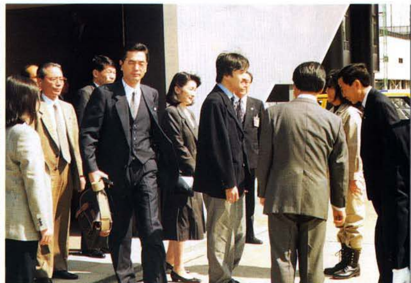
▲大阪国際空港に御到着の秋篠宮同妃両殿下（7月7日）