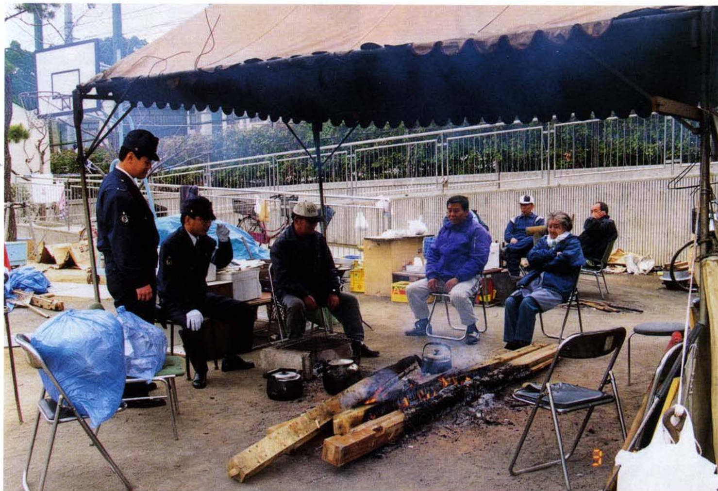
▲たき火の輪に入って（灘区） 75