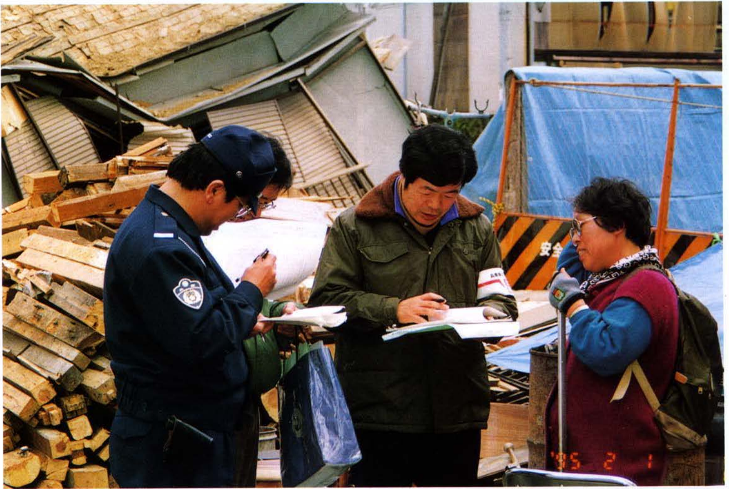
▲県職員との避難所緊急パトロール（東灘区）

パトカーに県職員と警察官が同乗して避難所を回り被災者の安全を確保するとともに要望等に応えた