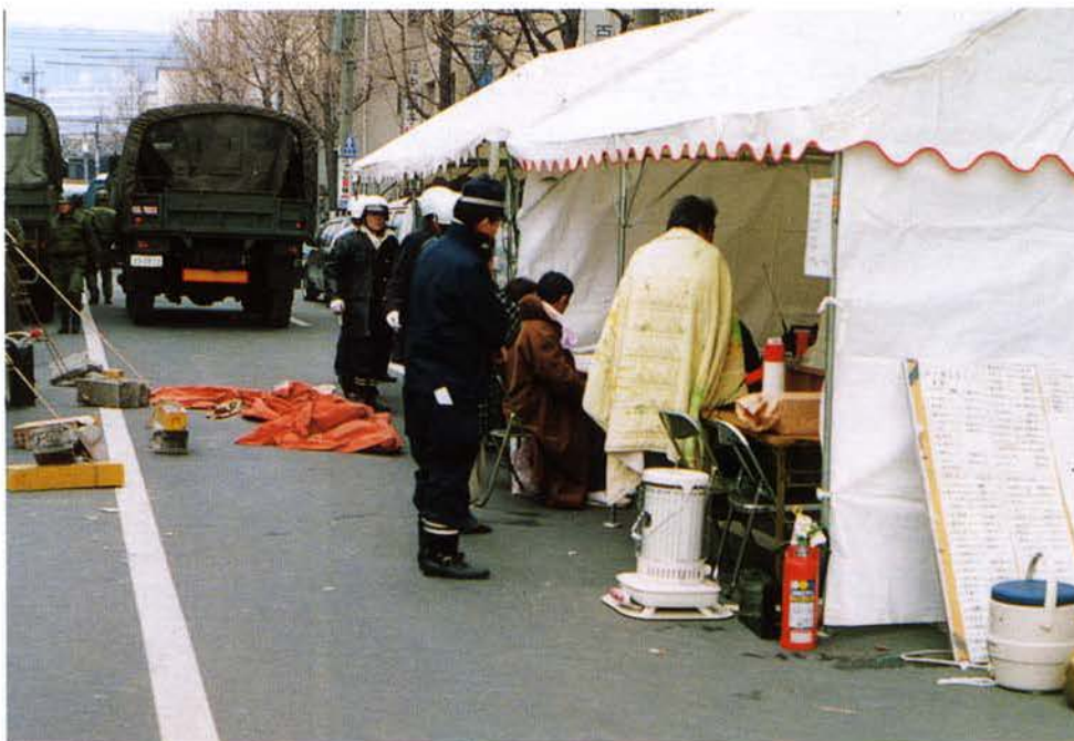
▼テントによる仮設拠点の設営 (兵庫警察署前)▶

避難所などでビラの掲出や移動交番の設置などにより情報提供を行うとともに各種相談所を随所に設け、被災地の不安感を払拭した