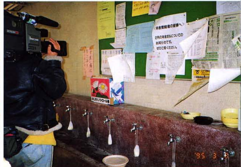
▲テレビ局が「のじぎくパトロール箱」を取材（兵庫区）