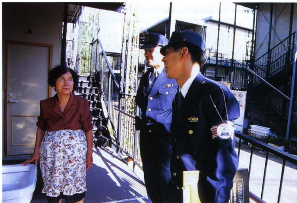
←フェニックス・パトロール隊 の仮設住宅訪問