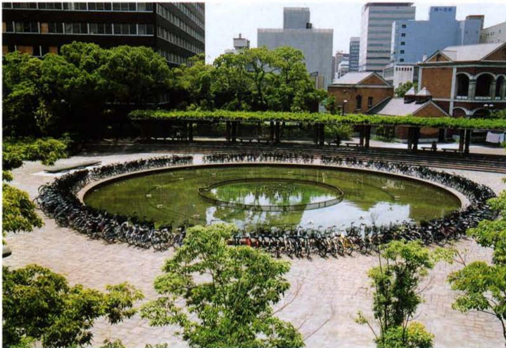
▲通勤の自転車置場となった公園（中央区）