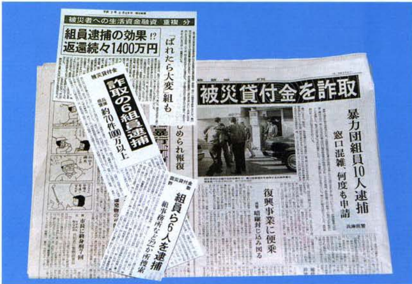
▲暴力団の被災貸付金詐欺事件検挙を伝える新聞記事 (左から)上、3月19日付朝日新聞、中、3月15日付神戸新聞、下、読売新聞、右、3月15日付産経新聞