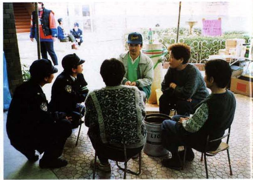
▲被災者からの相談を受ける隊員（兵庫区）