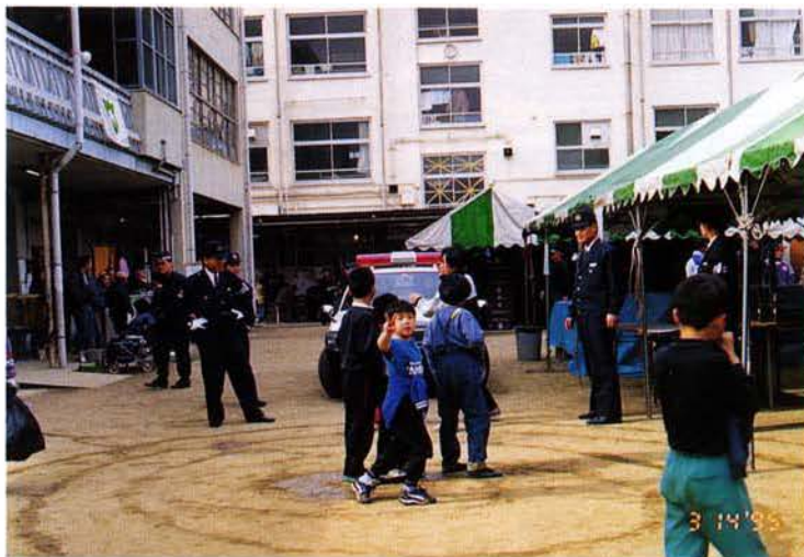
▲避難所となった小学校をパトロール（灘区）