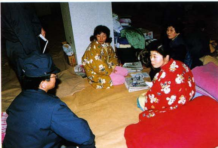
◀町民センター（北淡町）