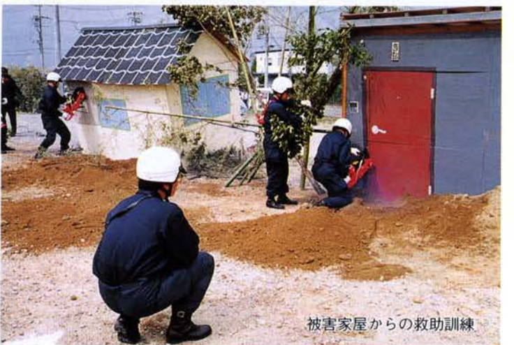
被害家屋からの救助訓練