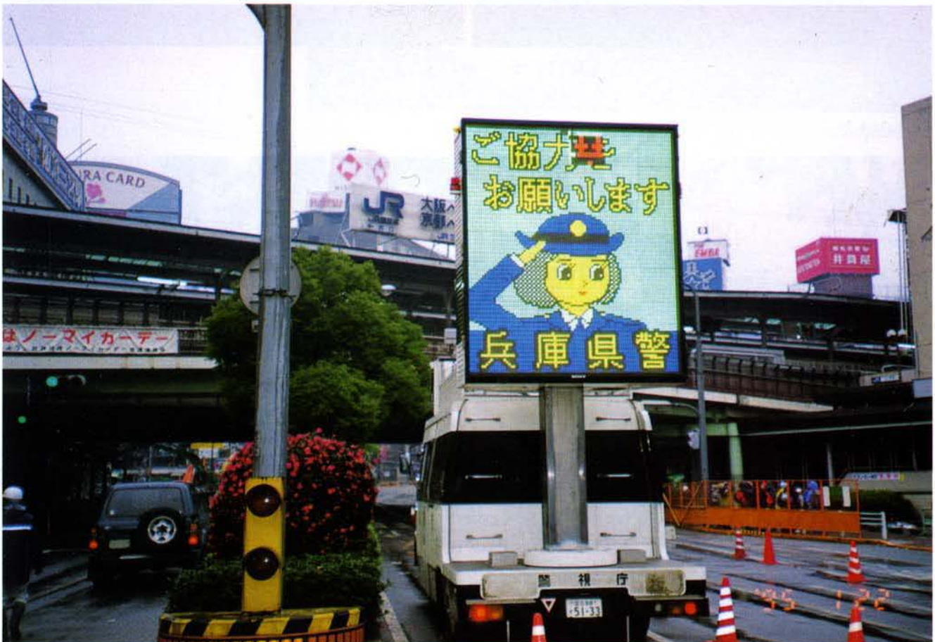
▲威力を発揮した警視庁のサインカー