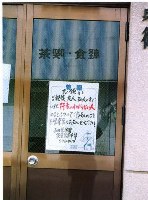
▲特報紙による呼び掛け