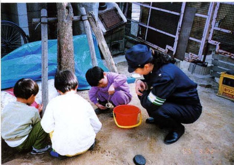
▲子供たちとのふれあいも大切にしている（長田区）