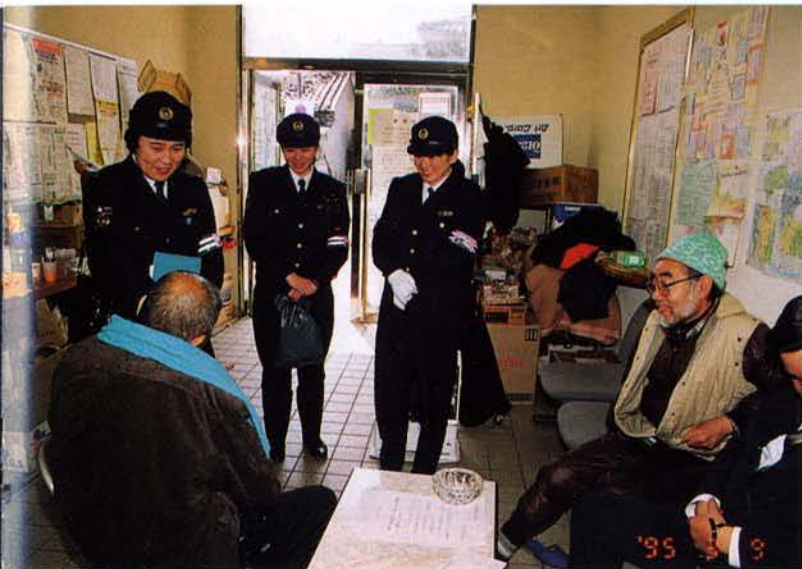
▲被災者を励ます隊員（兵庫区）

全国から特別派遣された婦人警察官により編成され、避難所等を巡回して住民ニーズの把握に努めた