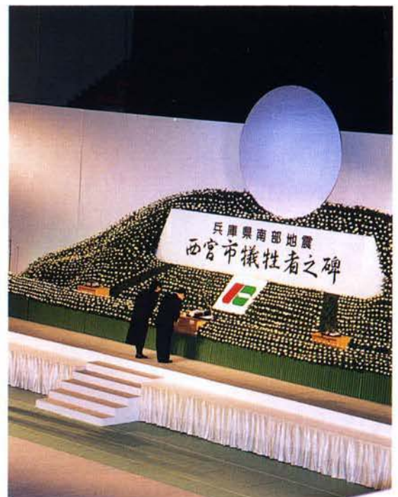
兵庫県立総合体育館 (西宮市・2月26日) ▶