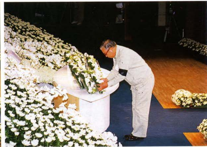
▲武村大蔵大臣の献花（神戸文化ホール）