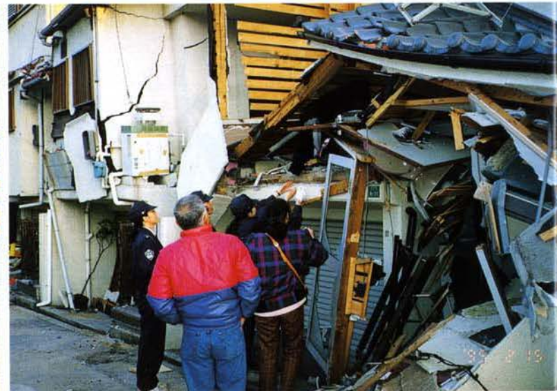
▲要望に応える（芦屋市）