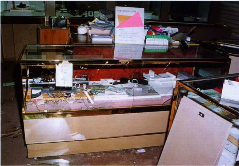
▲宝石類の被害状況（神戸市中央区）

警察は、震災の混乱に乗じた悪質な犯罪の取締りを強力に推進して、治安の確保に努めた