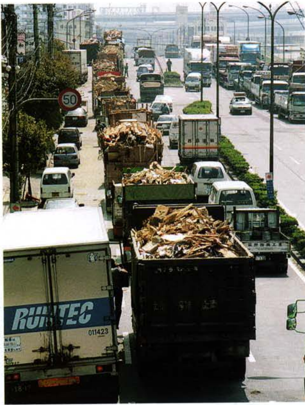
▲廃材を搬送するトラック（東灘区）