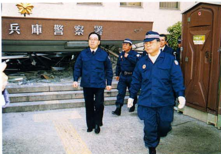
▲国松警察庁長官、兵庫警察署視察