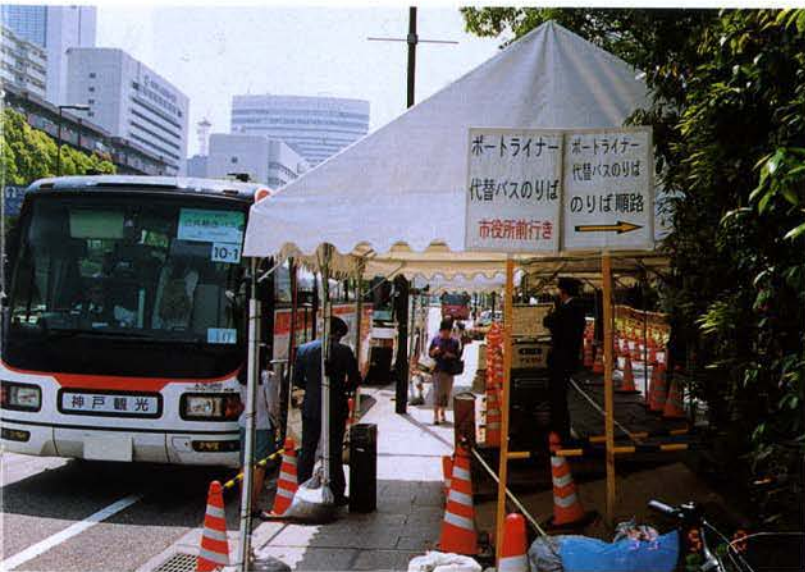
▲ポートルライナー代替バス乗場（中央区港島）