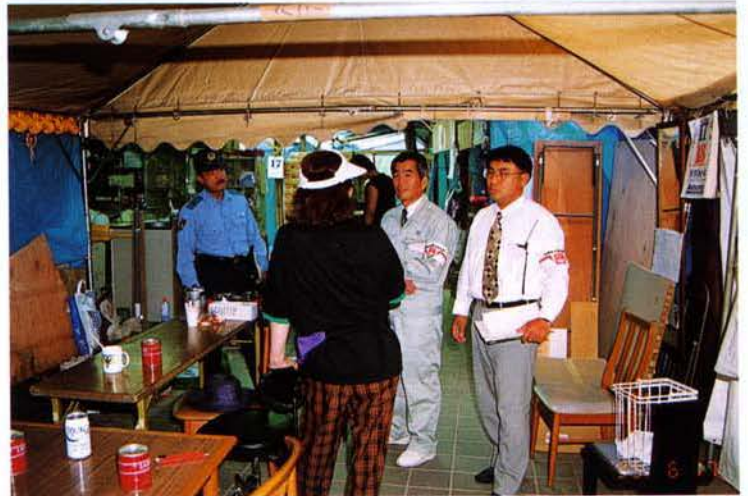
▶本町公園の仮設テントを訪れたパトロール隊（兵庫区）▶