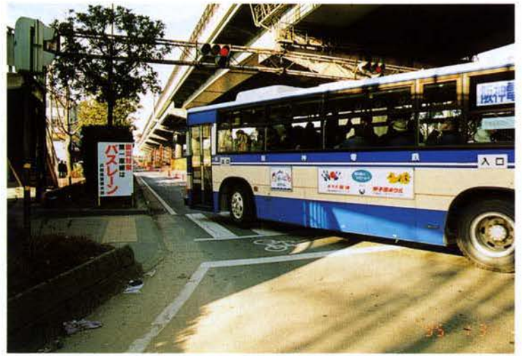
▲国道43号に設けられたバスレーン（東灘区）

鉄道が不通となったことから、通勤等の交通手段は、バスや船・自転車、徒歩に頼ることとなり、バス停は長蛇の列となった