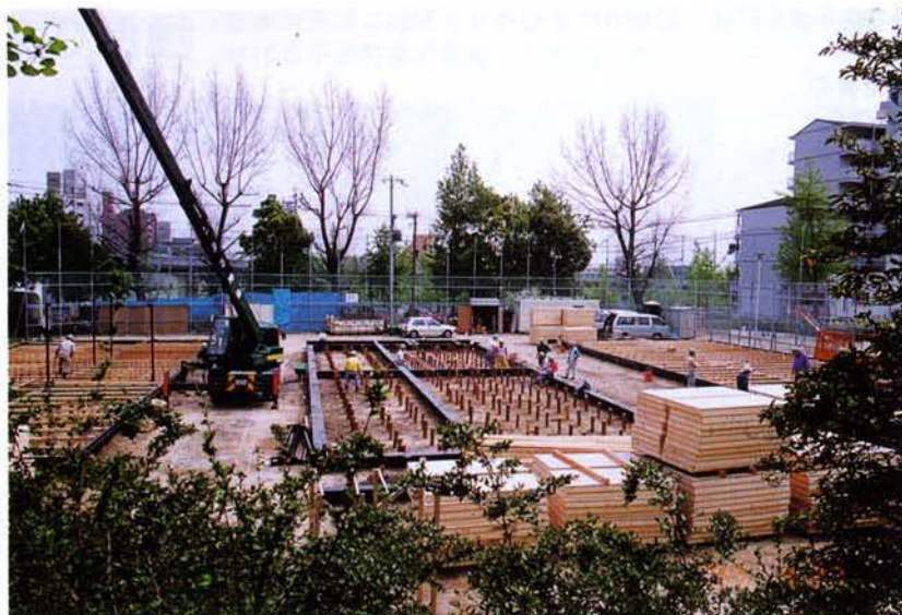
◀ 建設中の仮設住宅（灘区）