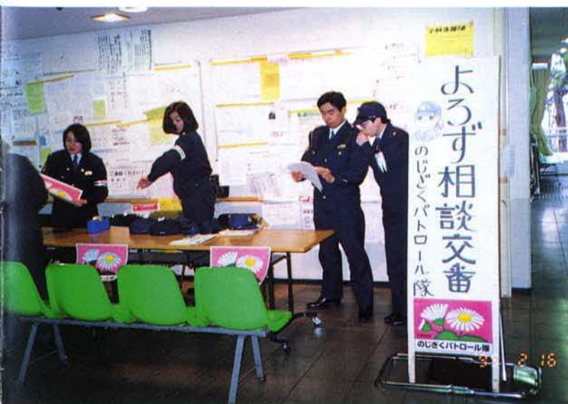
▲「よろず相談交番」の開設（灘区）