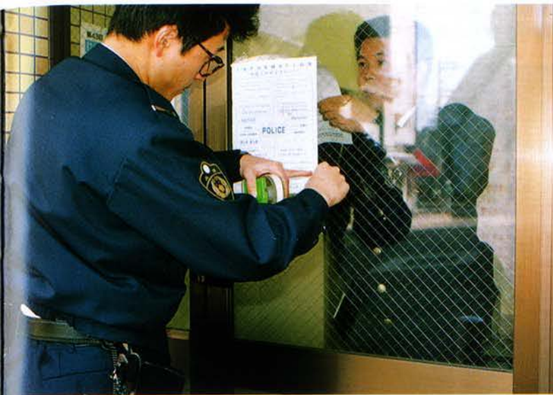
▲外国人のための震災関連情報