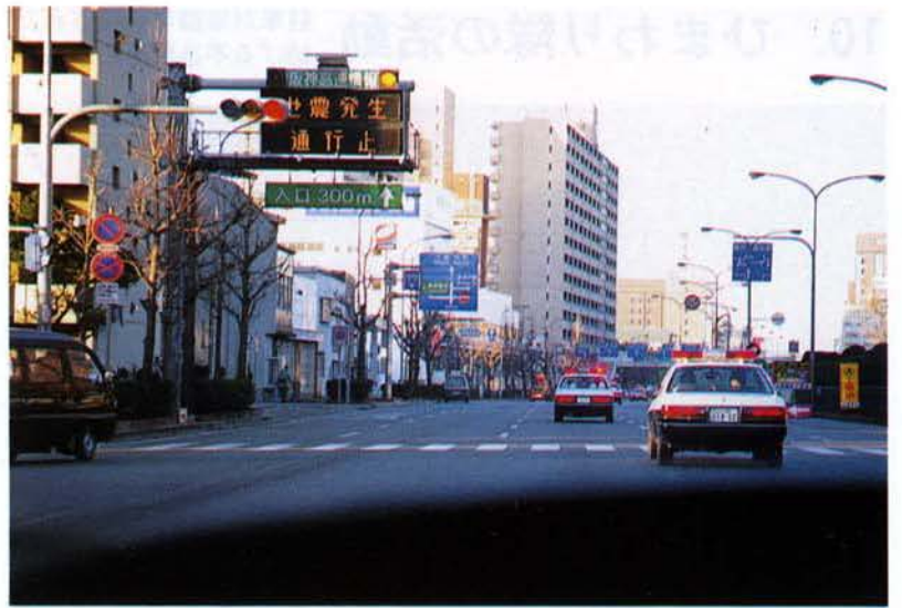
▲阪神高速道路の電光掲示板（中央区）

被災地の交通対策を有効に推進するために、エリアを限定して独自の交通規制や交通情報の提供を行った