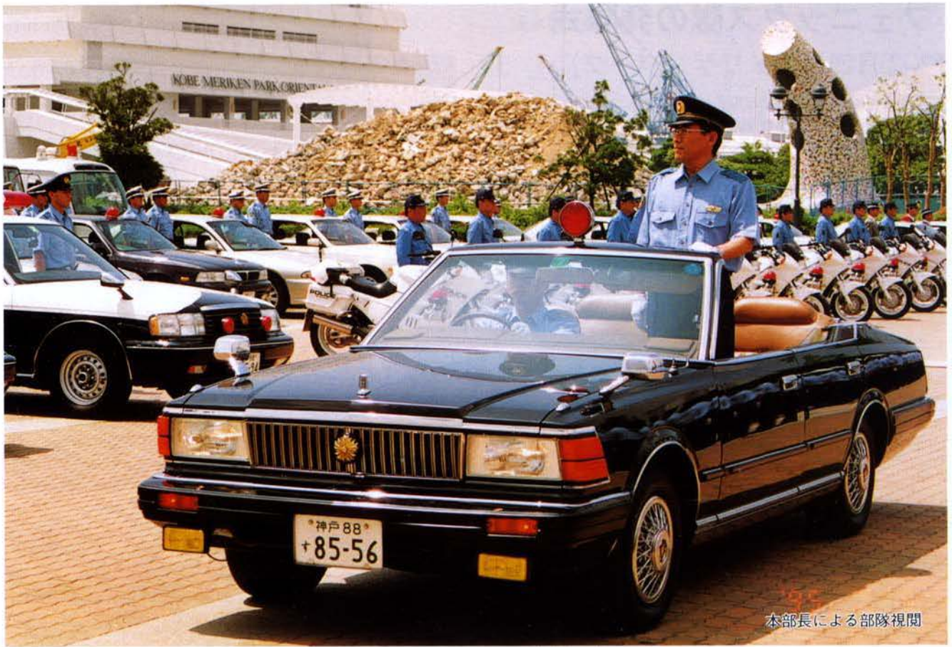
本部長による部隊視閲