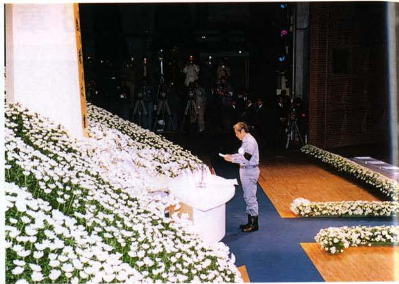
▲笹山神戸市長の弔辞（神戸文化ホール）