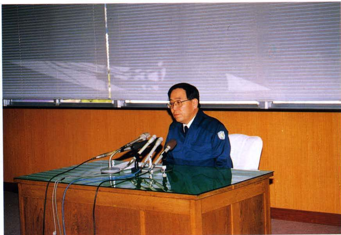
▲兵庫県警察本部生田庁舎で記者会見中の国松警察庁長官（1月24日）