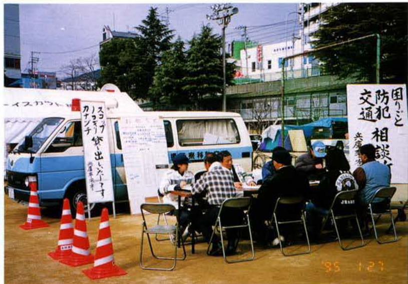
▲移動交番車による各種相談の受理 69