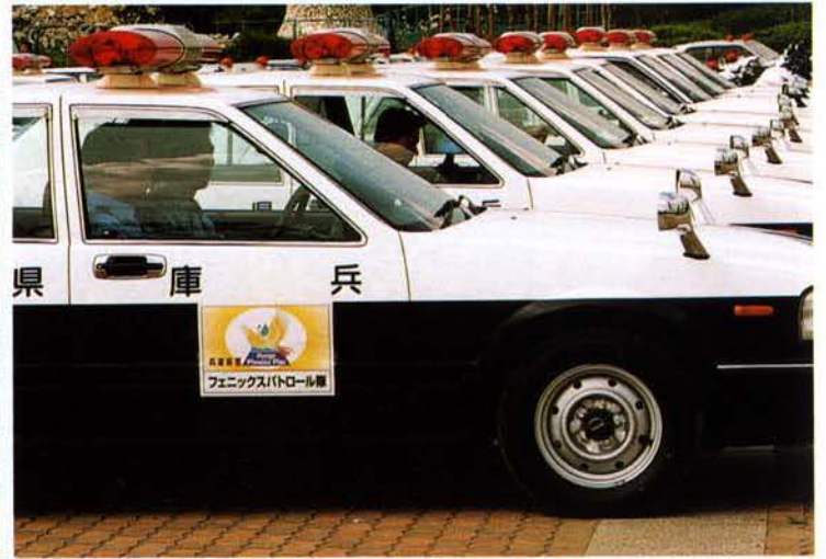
▲フェニックス・パトロール隊車両