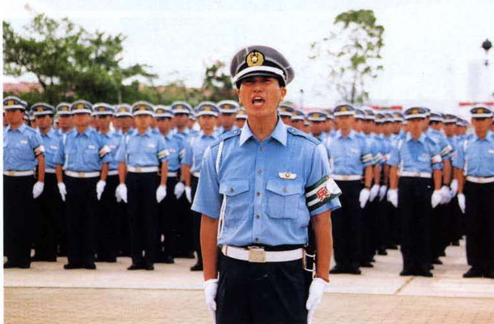
▲フェニックス隊代表による決意表明