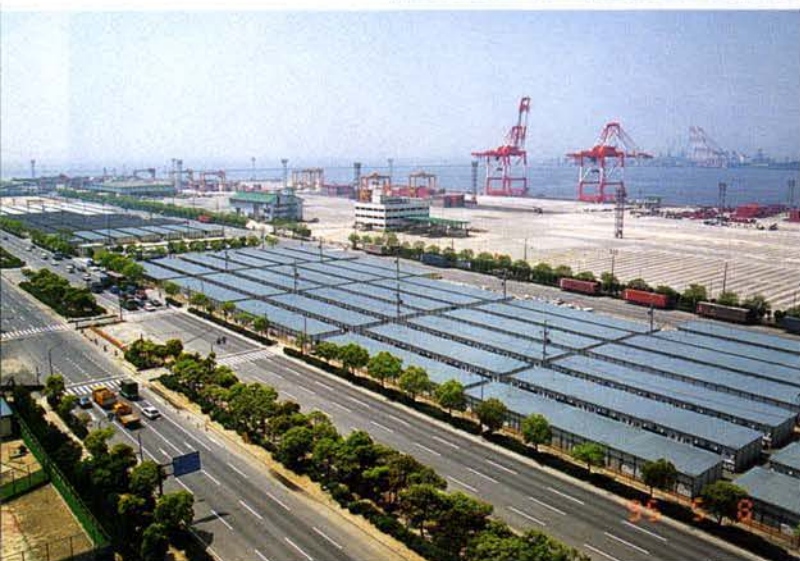
▲ 完成した仮設住宅（中央区港島）