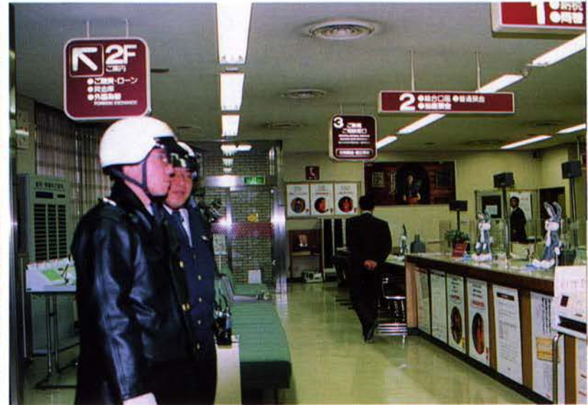
▲金融機関に立寄った警察官（中央区）