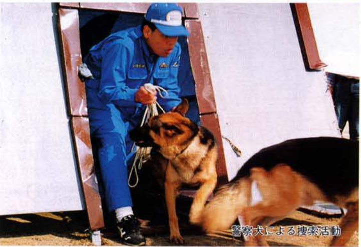
警察犬による捜索活動