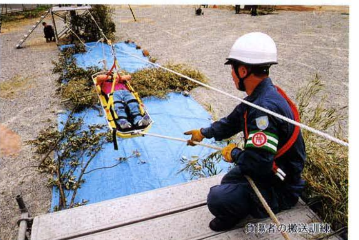
負傷者の搬送訓練