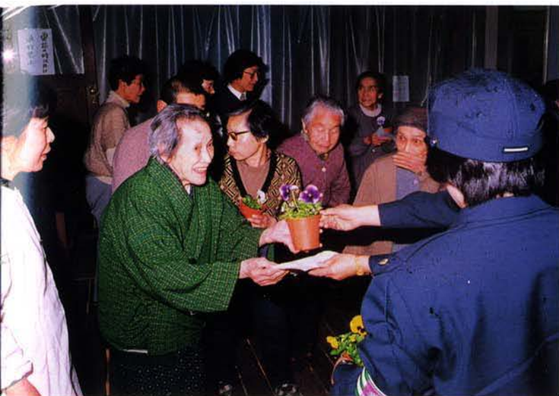
▲被災者に花鉢を配る隊員「心に花をフラワー作戦」(東灘区)