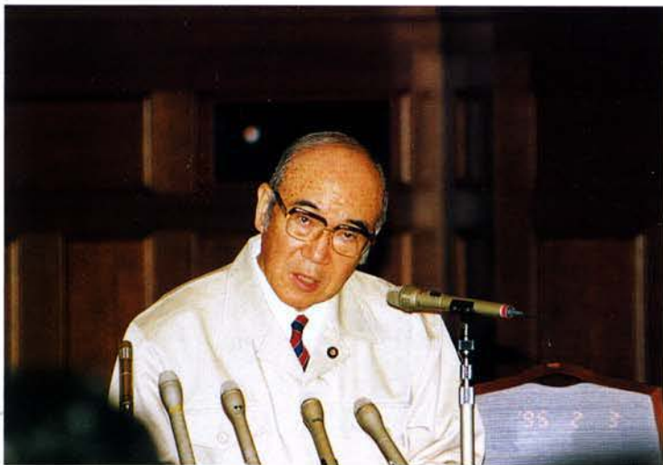
▲小里地震担当大臣の記者会見（県公館）