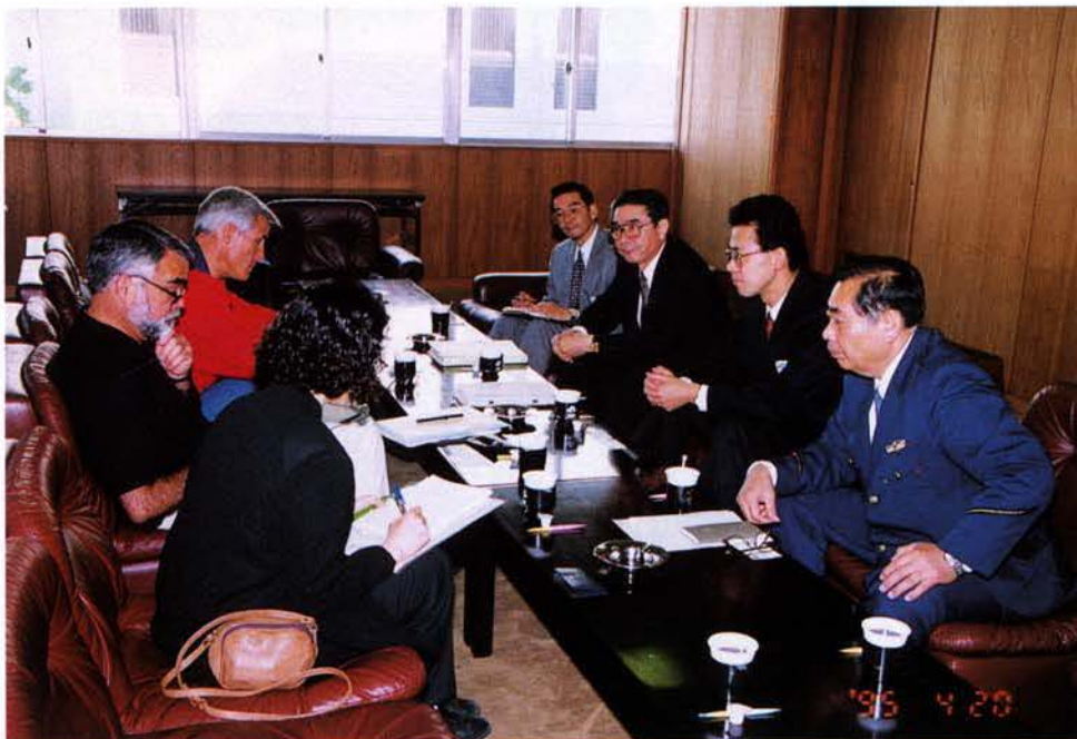
◀ロサンゼルス市役所地震調査団の受入れ (4月20日)