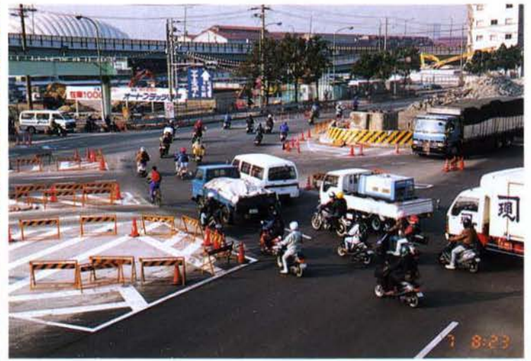
▲単車による通勤が急増（灘区）