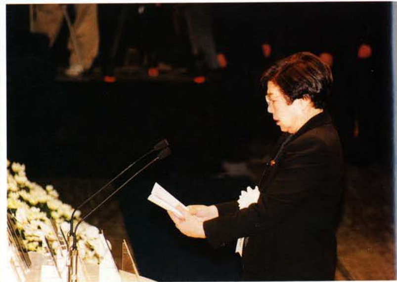
▲土井衆議院議長の弔辞（神戸文化ホール）