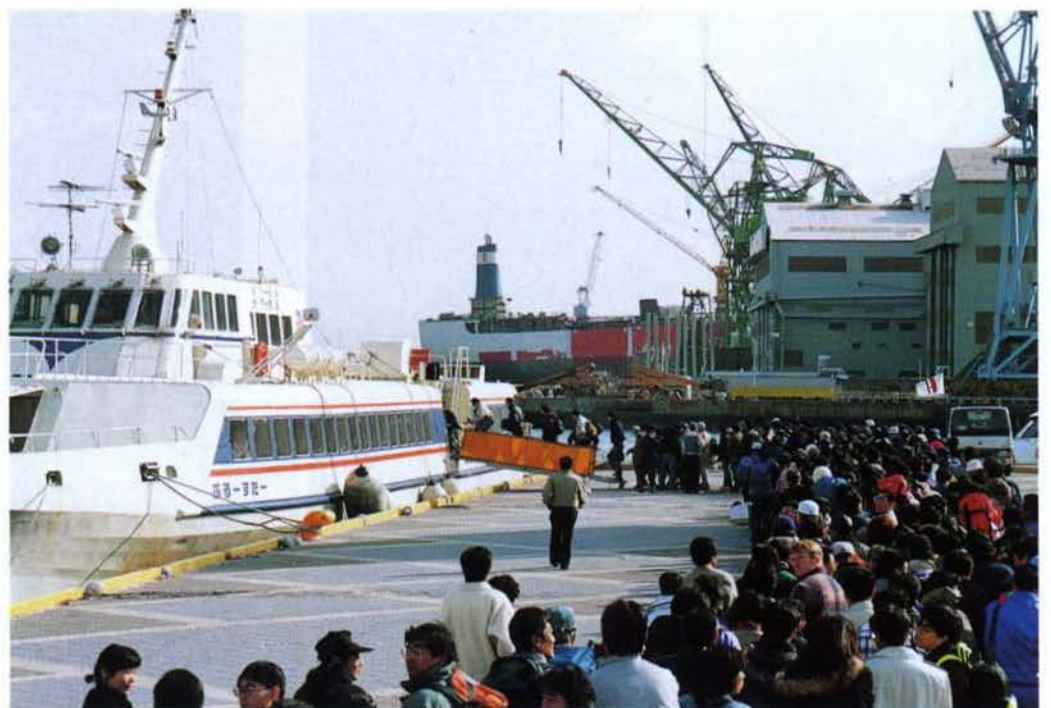
船で通勤する人波 （中央区ハーバーランド）▶