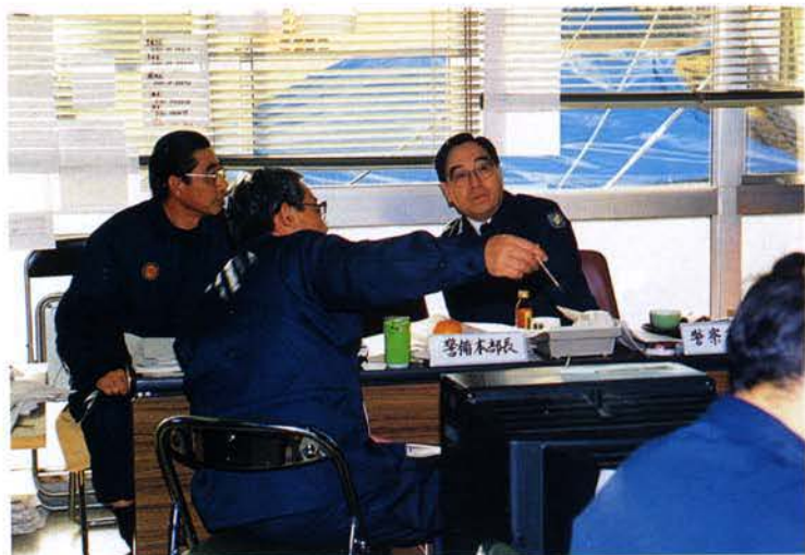
▲国松警察庁長官、警備本部激励訪問