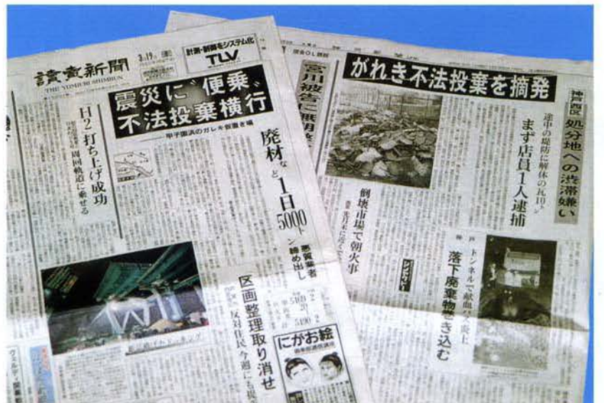
ガレキの不法投棄事件検挙等を伝える新聞記事 (左から)3月19日付読売新聞、3月9日付神戸新聞