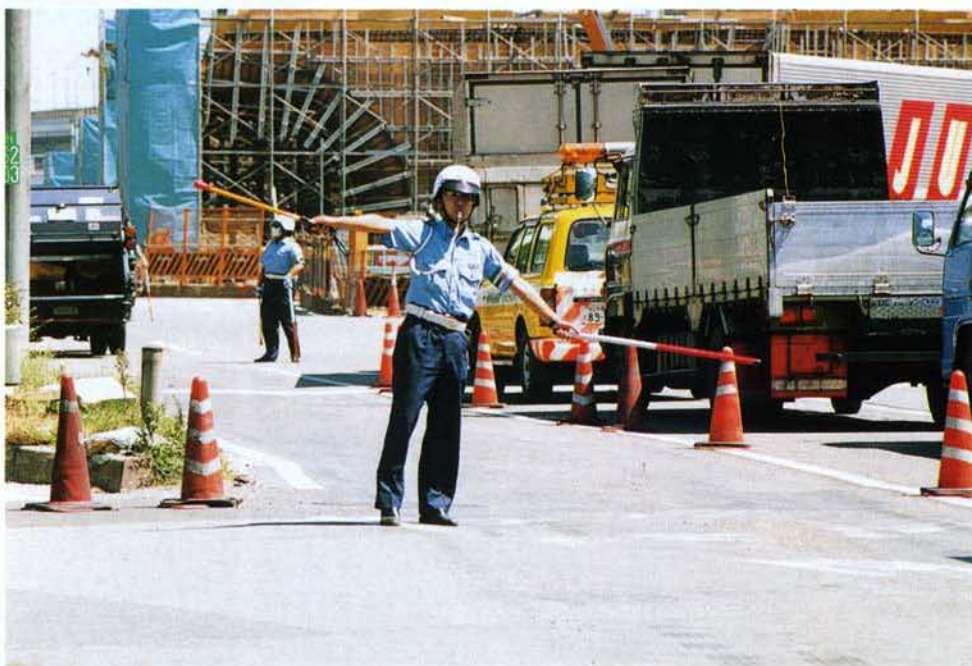
▼フェニックス・トラフィック隊 の交通整理▶