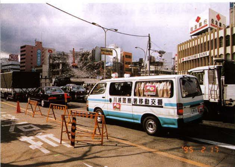
▲移動中の「のじぎくパトロール隊」