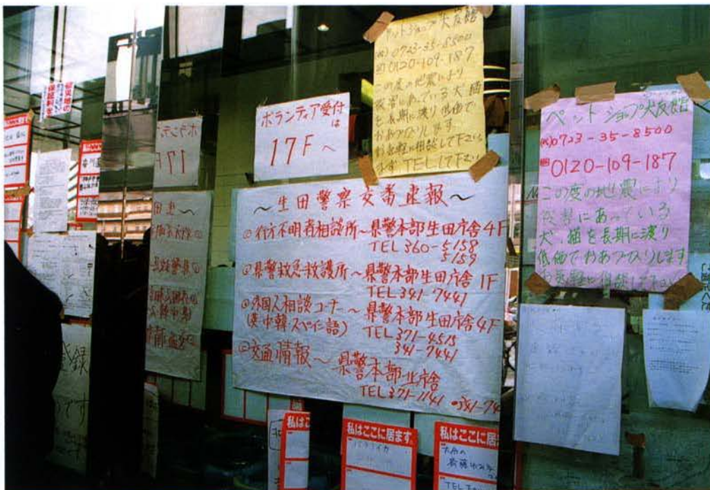
▲神戸市役所に貼り出された交番情報