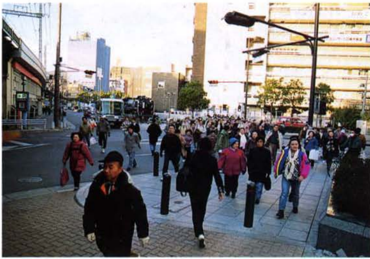
▲列車不通区間を歩く人々（中央区）