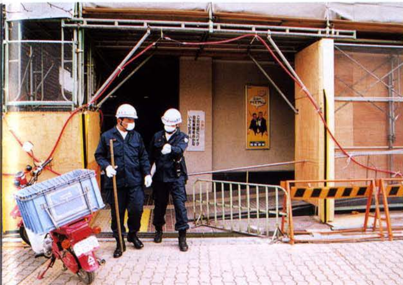
▲郵便局をパトロール中の警察官（兵庫区）