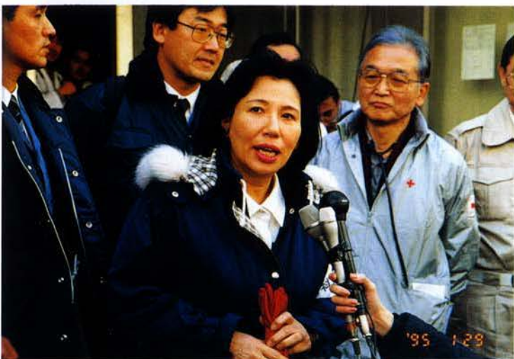
▲田中科学技術庁長官、神戸赤十字病院を視察・激励（中央区）