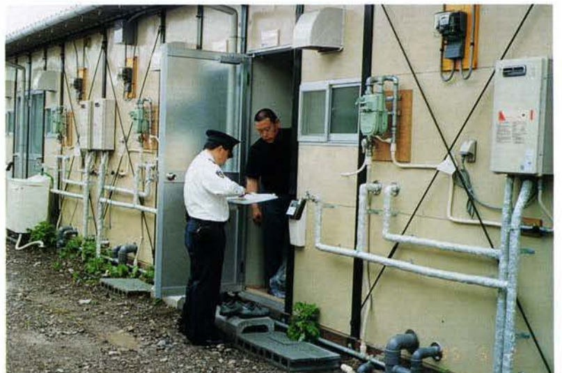
▲仮設住宅を巡回連絡中の飾磨警察署員（姫路市） 81