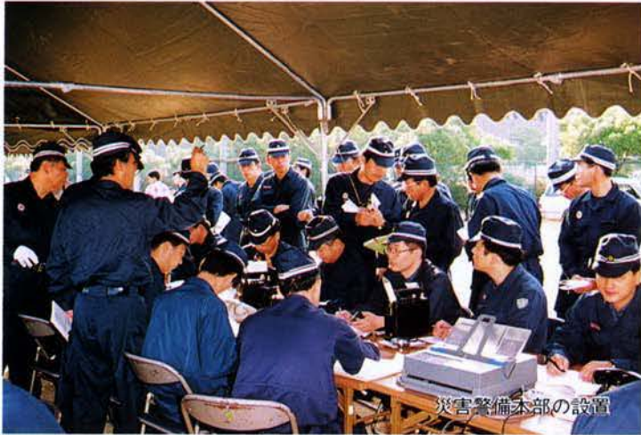
災害警備本部の設置