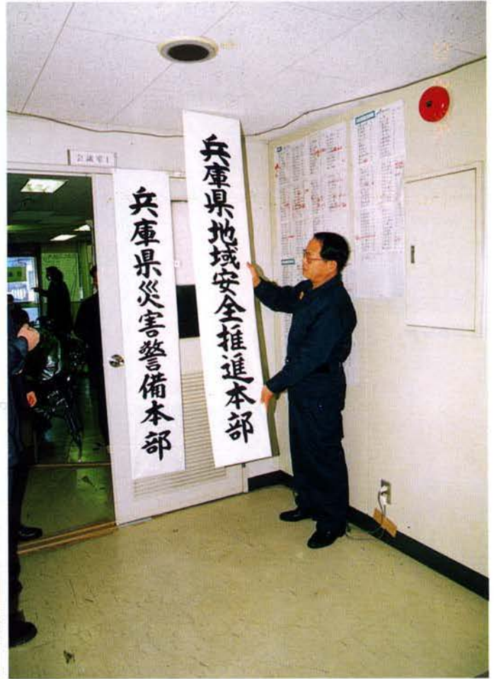
地域安全推進本部、2月10日に発足▶