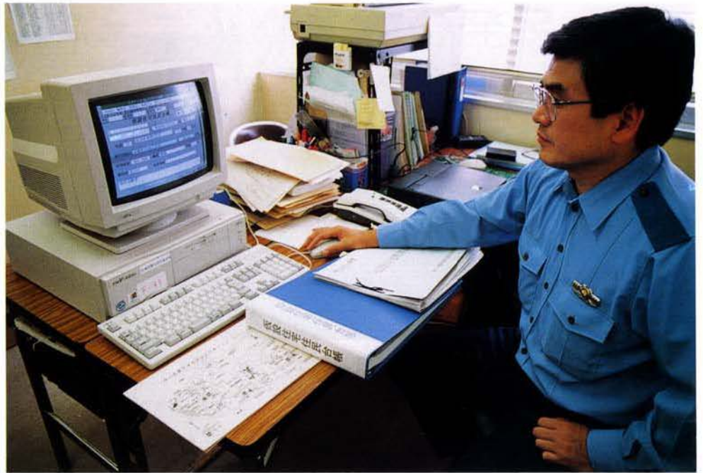
▲神戸西警察署管内では仮設住宅が多く、コンピューターに入力処理している

仮設住宅に入居する被災者の増加に伴い、巡回連絡の徹底などにより実態の把握と安全の確保を図った