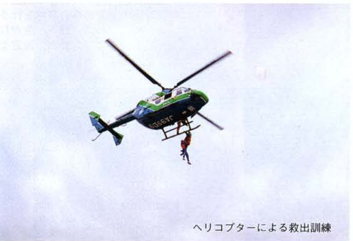
ヘリコプターによる救出訓練