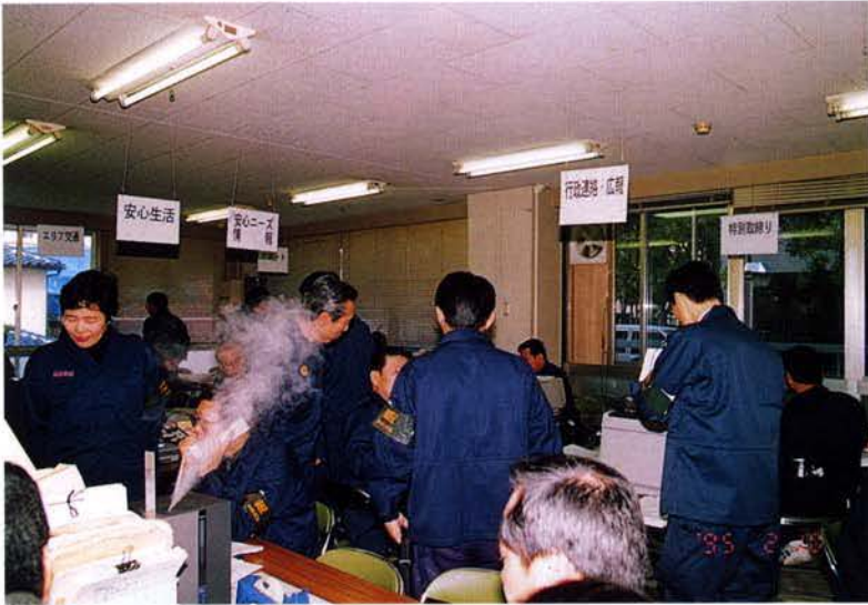
▲▼地域安全推進本部員の活動状況▶