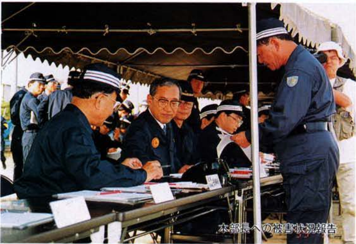
本部長への被害状況報告