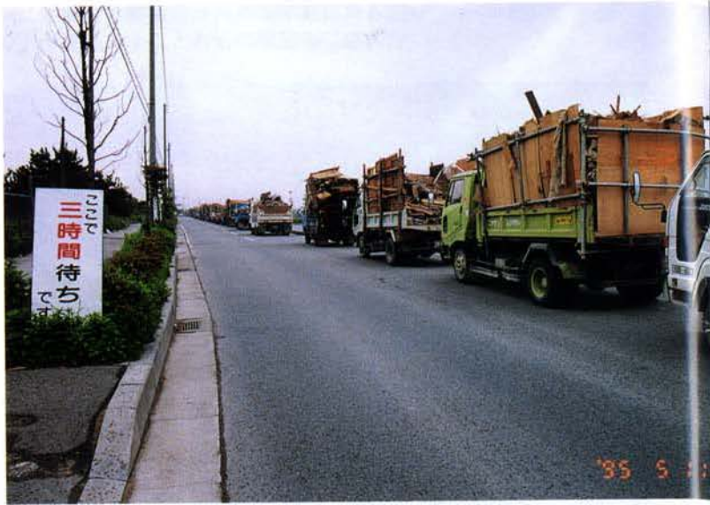
▲廃材を搬送するトラック（西宮市）

復旧作業が進展するにつれ、ガレキ搬送に伴う交通問題が生じたが路線指定や取締り等の対策を推進した