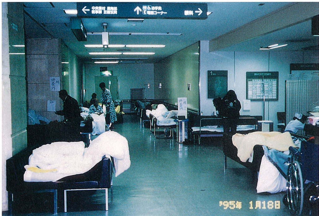
外来の廊下で治療を受けている患者さん

救急外来やその側の廊下で簡単な手あてがなされた後、重症の人は、三階にある集中治療室に移