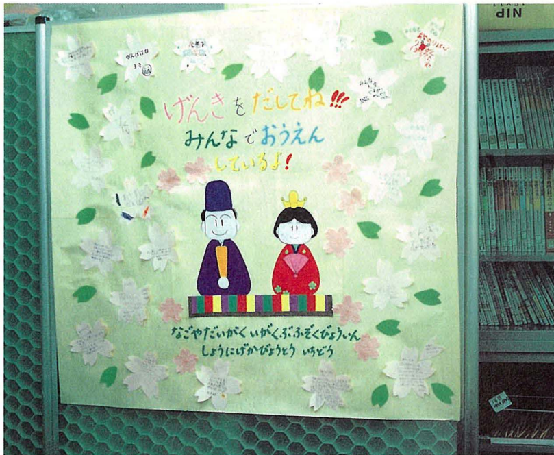
名古屋大学医学部附属病院の看護婦からの贈り物

地震がおこってから、ガス、水道、電気が回復するまでの間は、患者さんが増えたことや水道が使えなかったことなどによって、看護婦の仕事はふだんの二倍以上にも増えました。それらの仕事をするために、看護婦は寝むる間もなく働きました。その看護婦の中には、家がこわれたり燃えて家をなくした人も含まれていました。ボランティアの人々の助けによって、働き続けて疲れはてた看護婦に、平均二日間のお休みをあげることが出来ました。お休みを取った看護婦は、そのお休みを、壊れた家を片づけたり、体や心を休めたり、家族の世話をすることに使いました。