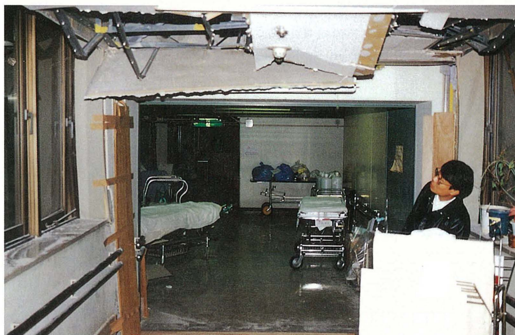
病棟の天井の破損

次に看護婦が行ったことは、余震の危険から患者さんを守るための避難の準備でした。避難の準備は