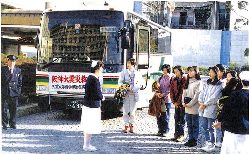
他の機関から応援に駆けつけた看護婦の皆さん

地震がおこったその日のお昼過ぎには、被災しなかった地域の病院から、治療に使う器具や薬、ガーゼなどの材料が支援物資として運ばれるようになりました。翌日からは、文部省の指導によって、隣接した県や遠くの地域にある大学病院から、治療や看護に必要な物、患者さんの生活に使う物や食料品や飲料水が、ヘリコプターやトラックで送られてくるようになりました。そのおかげで、多くの被災者の救急治療とその後入院治療を続けることが出来ました。また、全国各地から、多くの人々が神戸大学病院を訪ね、二日から二週間、ボランティアとして看護活動を支援しました。そ