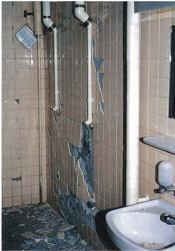
第一病棟 1階調理場南側トイレ壁等の損壊