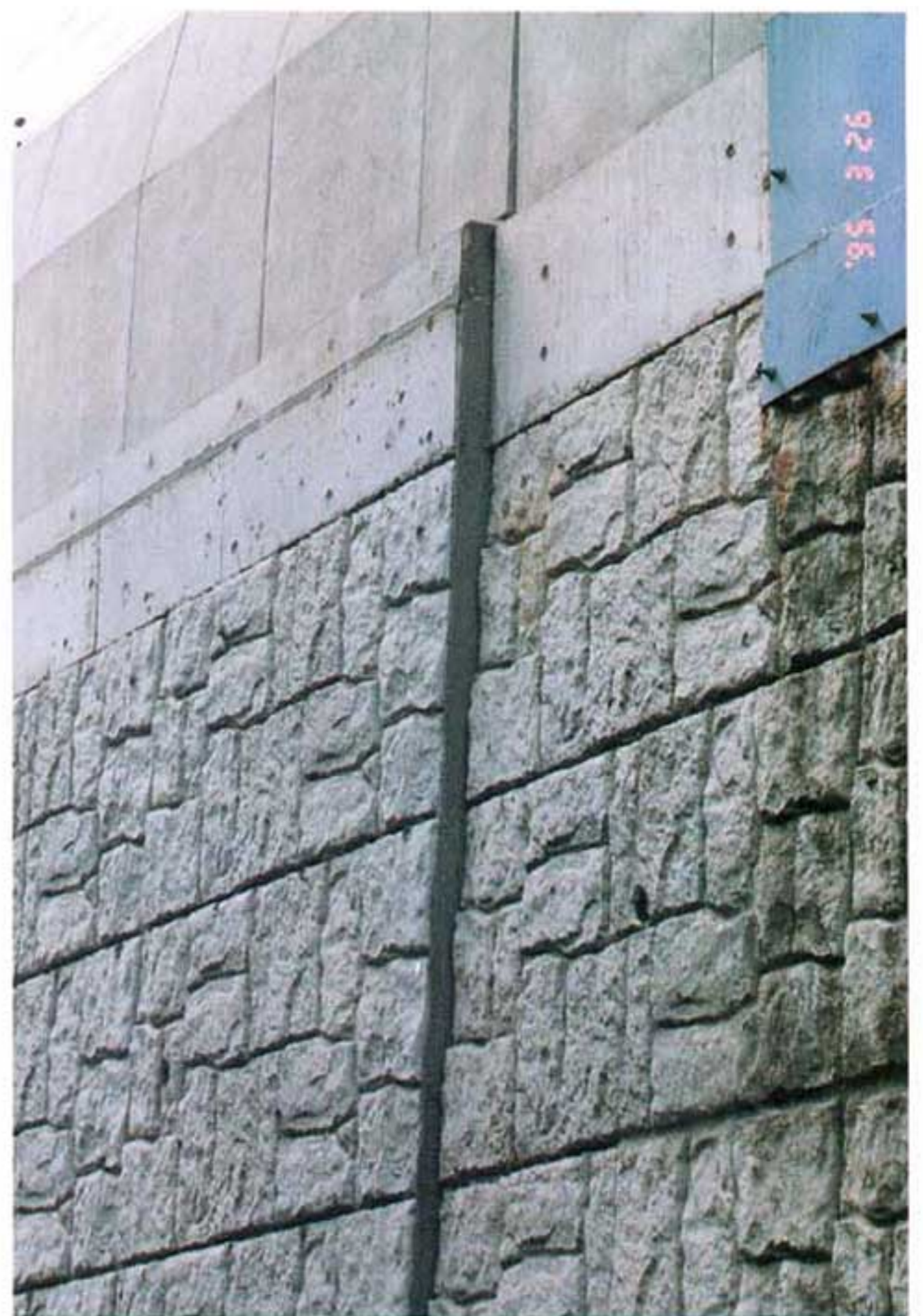
写真3.2-4 補強土擁壁の被害状況 (隣接ブロック間の相対変位 3～8cm)