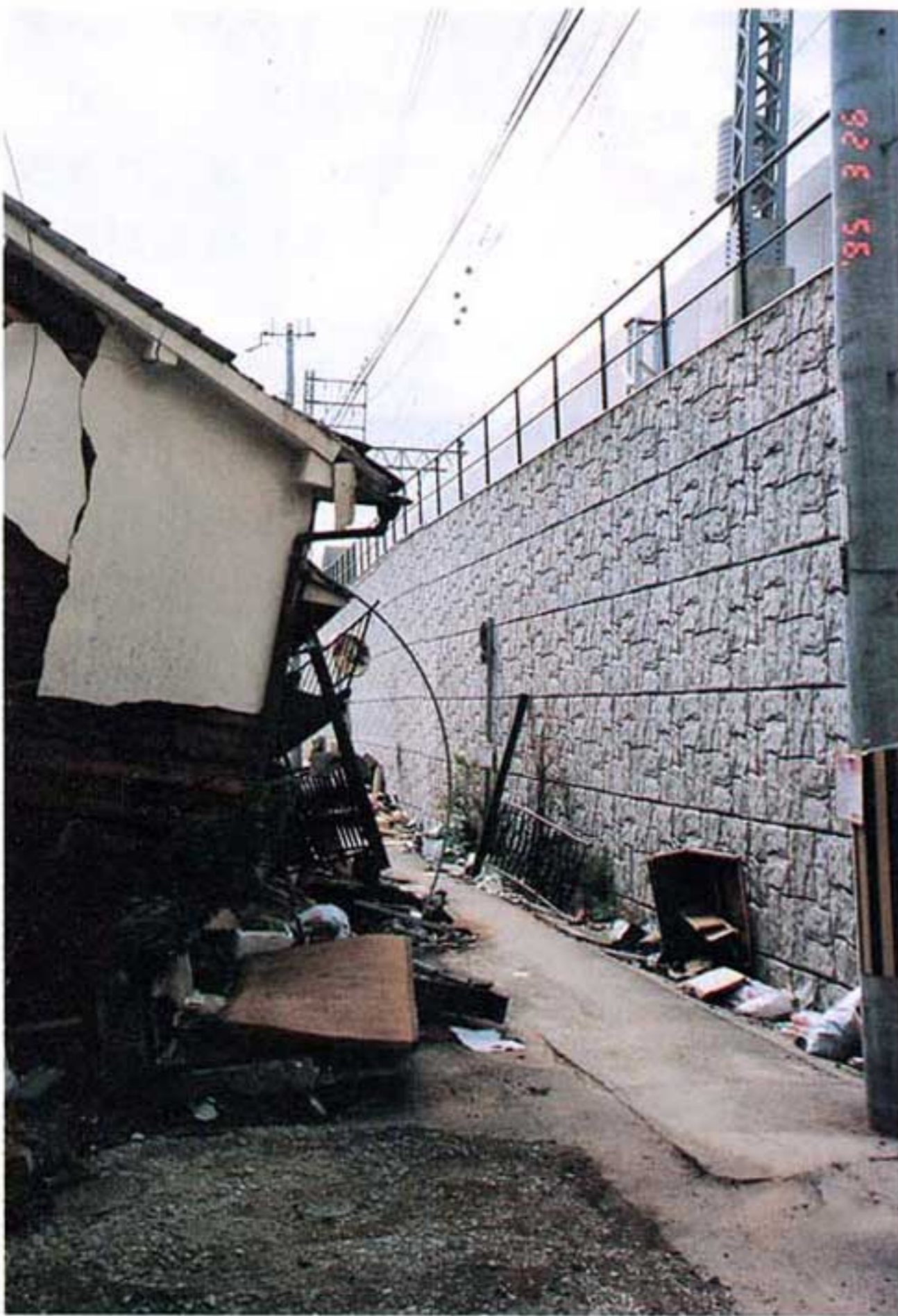
写真3.2-3 補強土擁壁と付近の被害状況 (JR摂津本山～芦屋間)