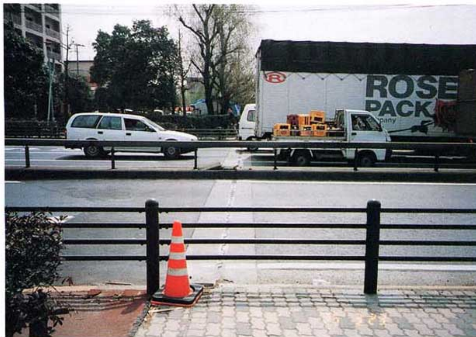
(b)橋台上面補修状況 ・中央分離の損傷跡 ・路面段差の補修跡