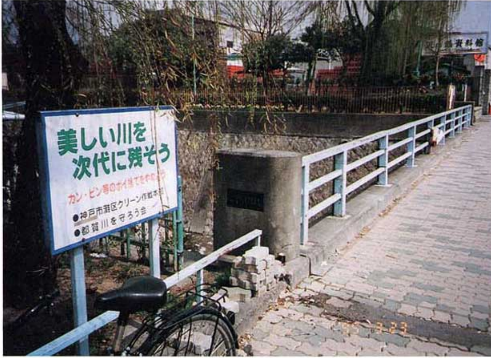
(a)橋台付近損傷状況