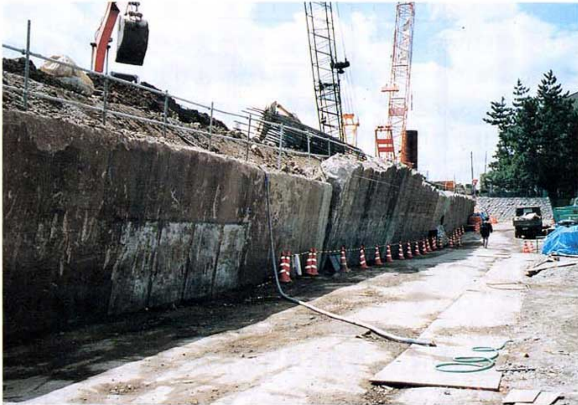
写真3.2-1 コンクリート擁壁の被害状況 (阪神電鉄石屋川駅付近)