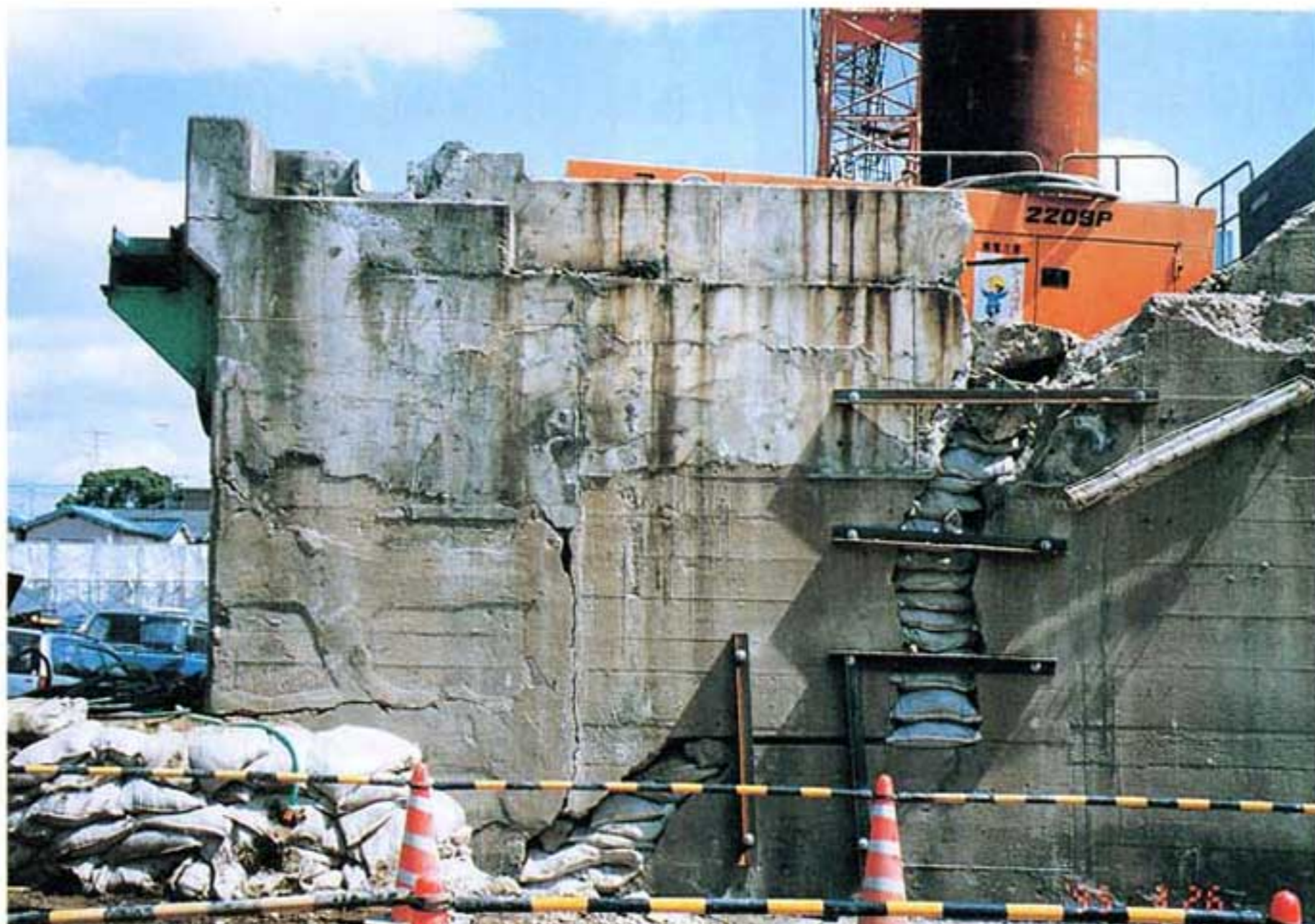
写真3.2-2 コンクリート擁壁の被害状況 (水平方向に約40cm移動)