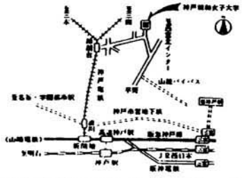
●神戸電鉄「神崎台」駅下車、東北へ徒歩約10分（バス3分）

☎六五一一一 神戸市北区鈴蘭台北町七十三一 神戸親和女子大学 学生部 学生生課 TEL. (〇七八) 五九一一六五二 FAX. (〇七八) 五九一一三一一三