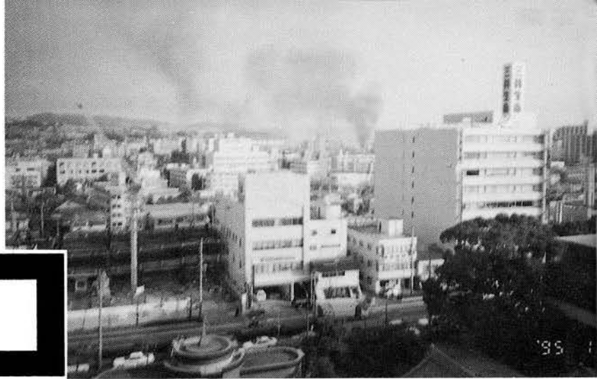
▲震災当日本庁8F より北を望む