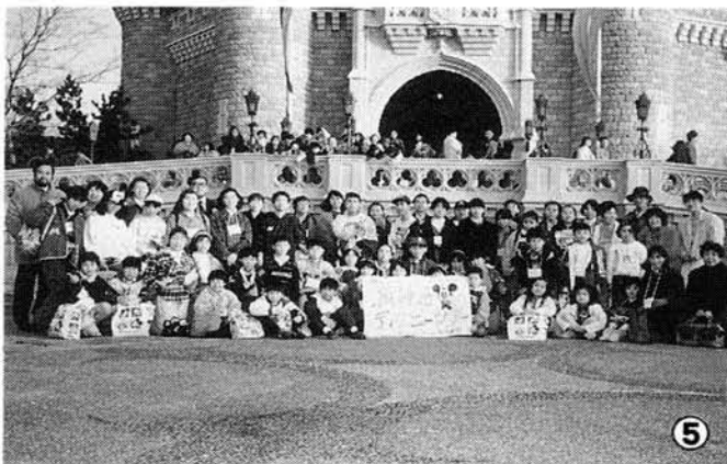
⑤ ボランティアによって企画された「阪神っ子ディズニーランドツアー」。