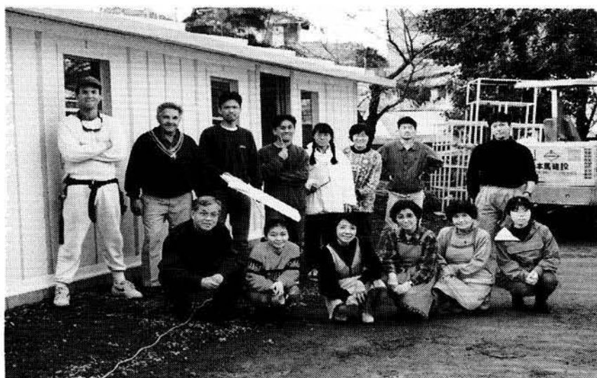
聖ペテロ幼稚園にて。

去年の暮、岡山に帰郷する際に再び神戸の街を訪れました。そこには、がれきが片づいた空き地が広がっており、徐々に新しい建築物が建ちつつありました。あの神戸が物質的にも精神的にも本当の意味で復興するまでしばらく見つけたいと思います。