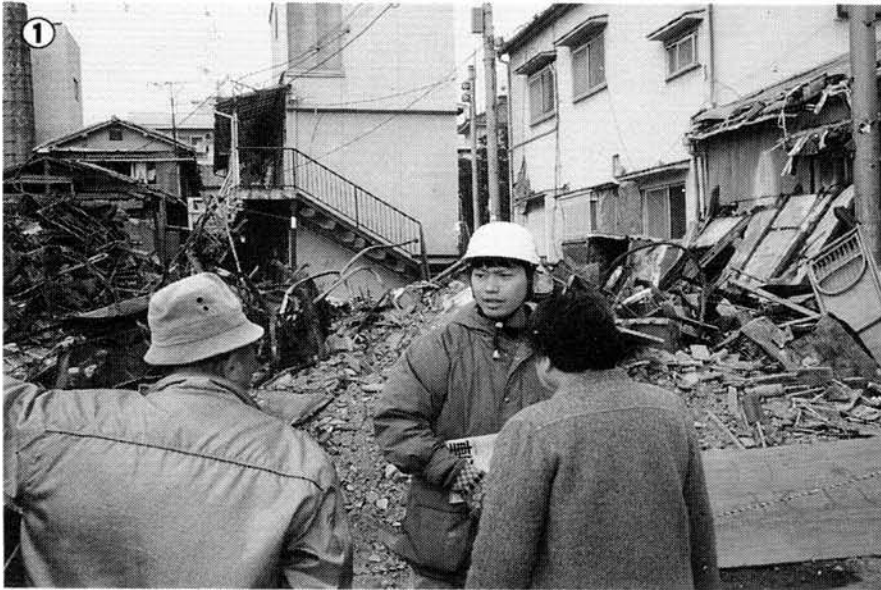
① 救援活動をするワールド・ビジョン・ジャパンのスタッフ。 ② 神戸市立福住小学校へ救援物資を届ける。