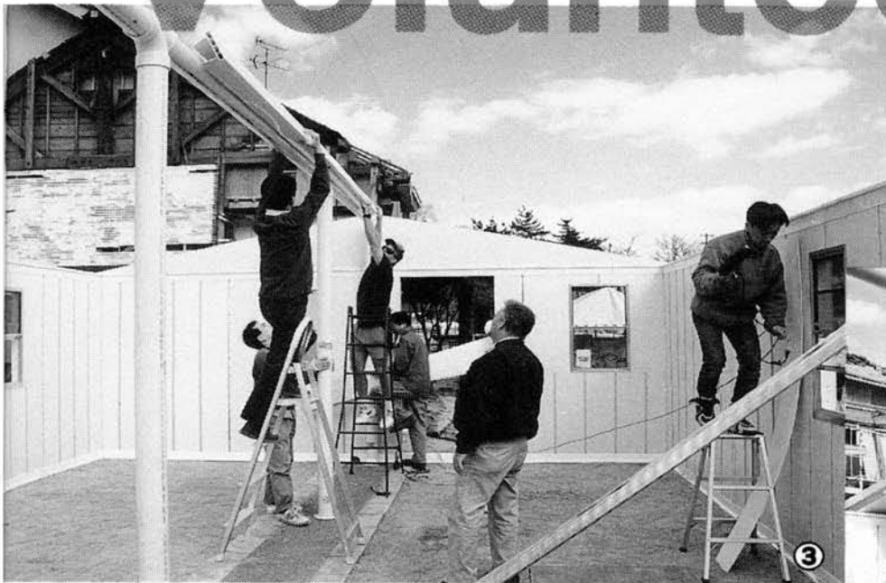
③ 神和教会で働くボランティアの方々。 ④ 神戸平安幼稚園で来日したアメリカ人ボランティア技師。