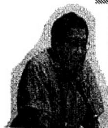
神戸の冬を支える会

また、会場の中からは、こういった生活保護の問題に関して、相談できるような所がないことや尼崎や西宮から来られた方々からの相談も寄せられました。神戸の冬を支える会としても今後の取り組みの中で、野宿を強いられている人たちだけではなく、家はあっても追いつめられ苦しい生活を強いられている人たちとも、一緒に闘っていく必要があることを実感した講演会でした。