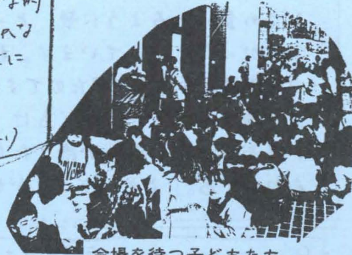
会場を待つ子どもたち