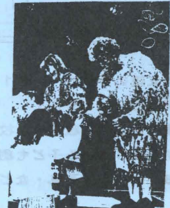
劇団員へ花束を贈る子どもたち