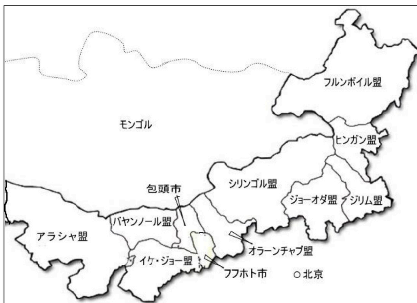
地図 1 内モンゴル自治区各盟域 4

内モンゴルには、自治区下に清朝時代から引き継ぐ盟とその下に旗・県が存在し、さらに文革当時は人民公社と生産隊といった五つのレベルの行政単位があった 3 。これまでの研究では主に都市部や個人の事例（啓之 2010；楊 2009b、2009c など）が中心に語られてきたが、最近の研究では内モンゴルの農村地域でも被害が拡大していたことが指摘されている（アルチャ 2017、2019）。これらの研究で、啓之の研究は文革による迫害は自治区内の各行政レベルで発生したことを指摘したが、人的被害はどの行政レベルでより深刻だったのかという問題に関しては必ずしも詳細な検討が行われたと言えない。すなわち、被害者の分布パターンが未だに把握されていないままなのである。これは暴力拡大の原因や文革運動の具体的なプロセスの実態解明につながる問題でもある。本考察では、文革後に自治区政府が出した公文書と自治区内で出版された地方誌による被害者の数量データに対する分析を通じて、自治区内における被害者の分布パターンと被害の規模について検討する。その際、同自治区の文革を主導した政府機関の役割に注目し、自治区全体における暴力拡大の原因、大規模な迫害が発生した政治プロセスを明らかにすることを目指す。