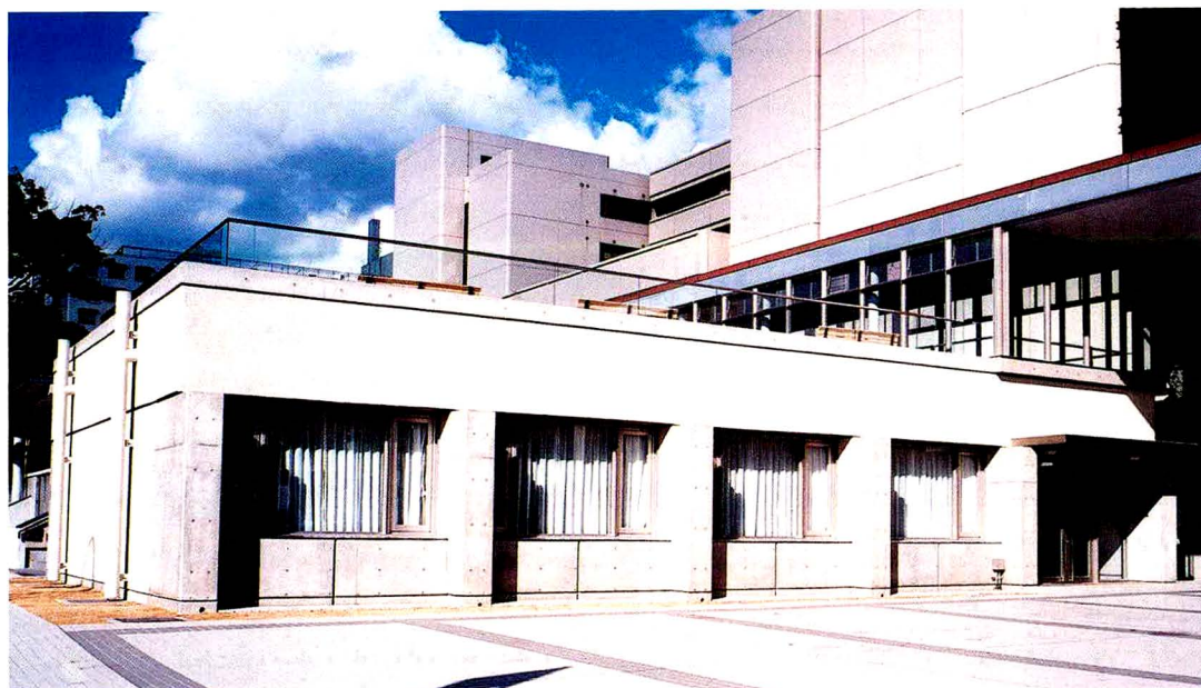
神緑会館（研修室と玄関，背景は病院の外来棟）