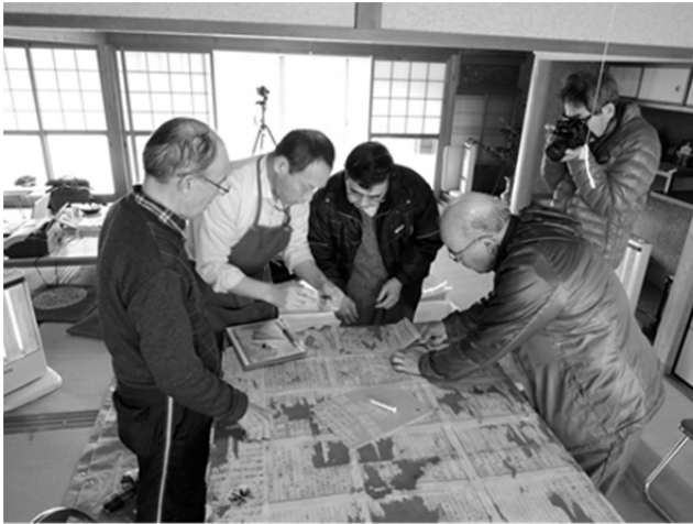
襖下張文書はがし作業