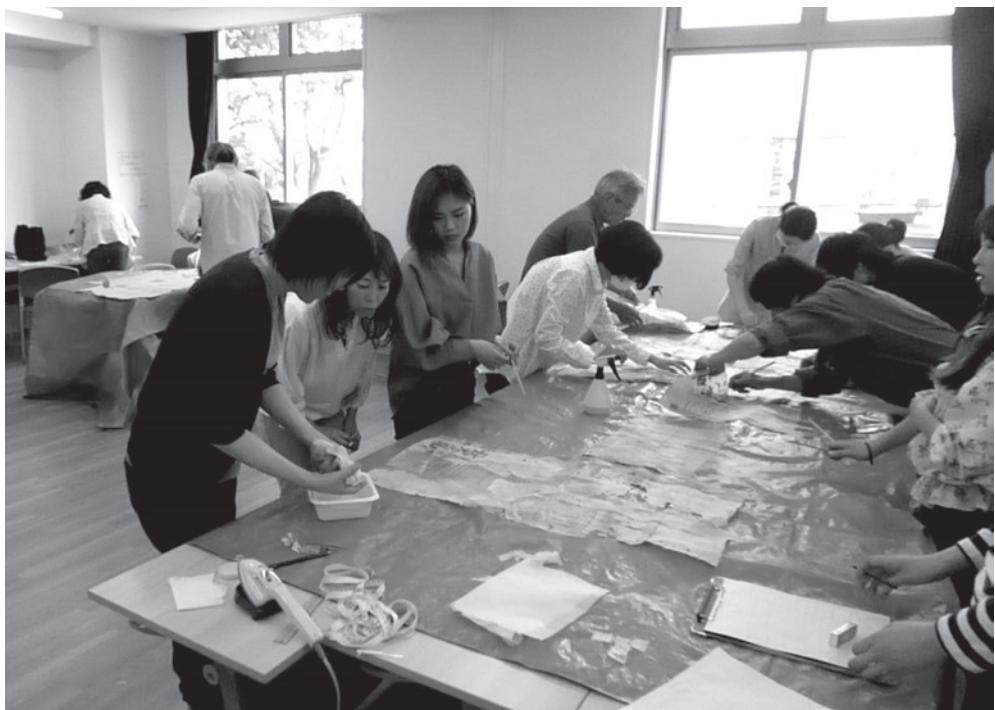
写真1 尼崎市立地域研究史料館 市民ボランティアによる作業風景 2019年

作業マニュアルの作成や剥がした史料の効率の良い管理方法と調査手法が同史料館職員の努力で行われ、それらを公開・公表することにより国内各地の同様の事業あるいは事業を検討している自治体や各種ボランティア団体から注目を集めている。近郊のみならず遠方からの視察や参加者も受け入れており、最新の剥がし事業のノウハウを発信している。一〇年余り続いている活動からは、作業に必要な四つの流れを熟知した市民ボランティアが近隣の同様事業において技術的な指導が可能な人材にまで育っている。 7)