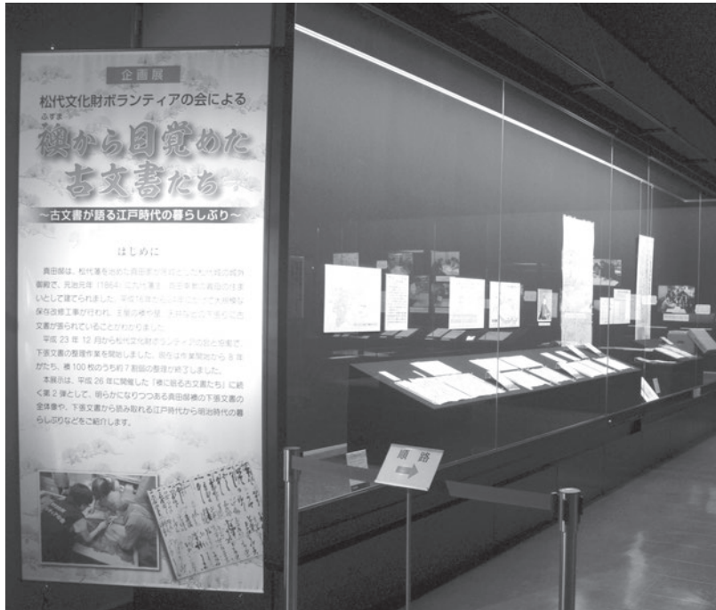
写真3 真田宝物館企画展「襖から目覚めた古文書たち」2020年1月25日～3月23日