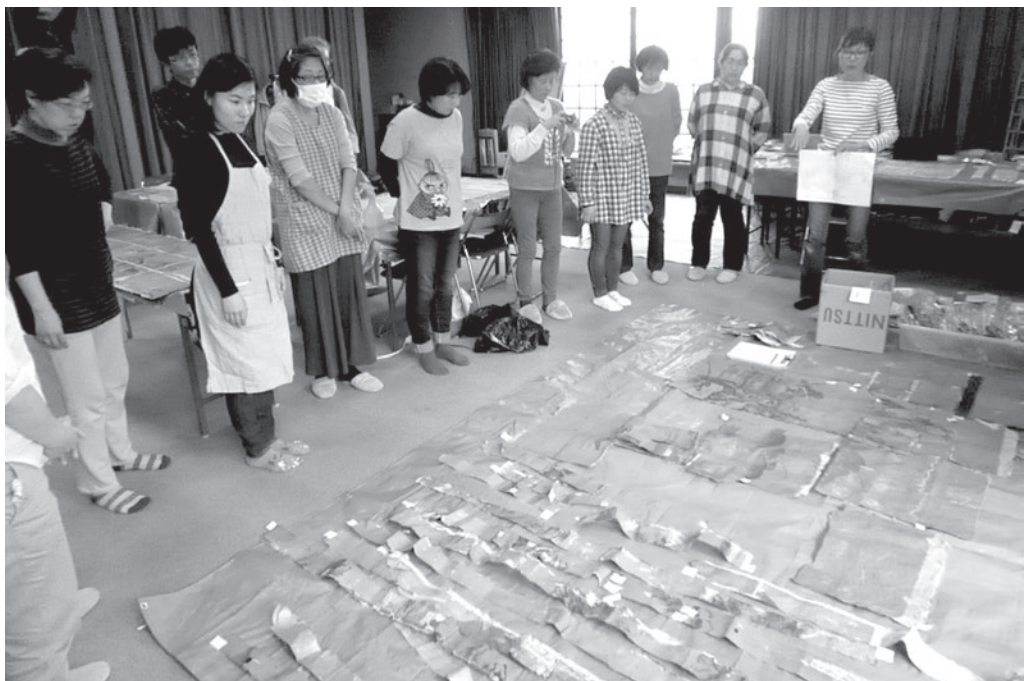
写真4 親王寺 屏風から取り出された絵画断片の同定作業風景 2018年