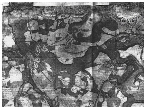
図4. 1745年当時の図絵(リーディガー・プラン)

の領邦全図(リーディガー・プラン Riediger-Plan)に様々な趣向をこらしている。このようにヨーロッパにおいて18世紀が製図の全盛期であると同時に、大量生産に向けた移行期でもあった。