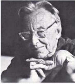
图 4 Carl Orff