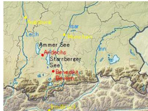
図2 カルミナ・ブラーナ編纂関係地（ドイツ南部，同）