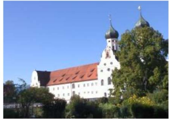
图 10 Kloster Benediktbeuern