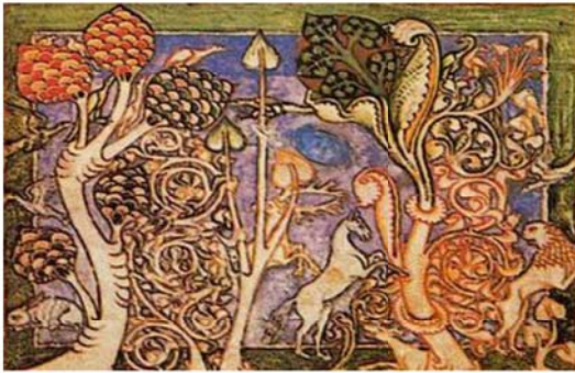
图 6 Codex Buranus-2