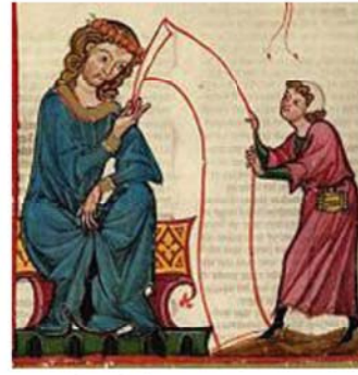
图 9 Graf Otto von Botenlauben