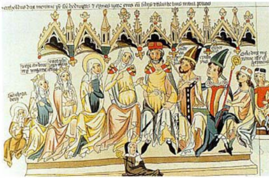
图 5 Andechs-Meran