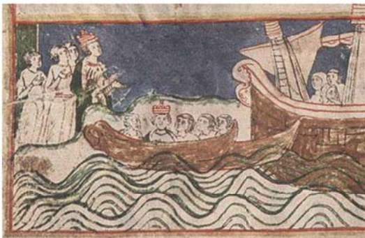
图 8 Codex Buranus-4