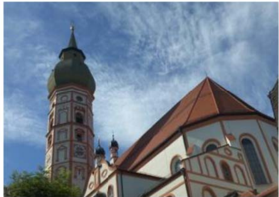
图 11 Kloster Andechs (同)