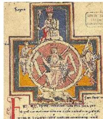
図3 Codex Buranus-1