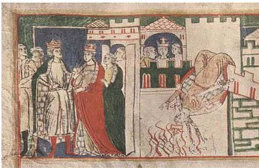
图 7 Codex Buranus-3