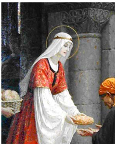
図3 The Charity of St. Elizabeth (1895, E. Leighton)