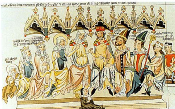
図2 Haus Andechs-Meranien