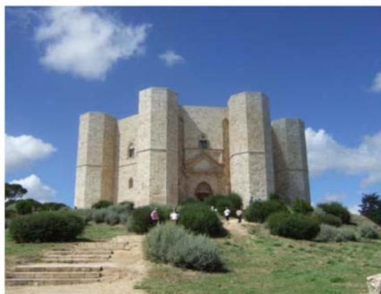
図4 Castel del Monte