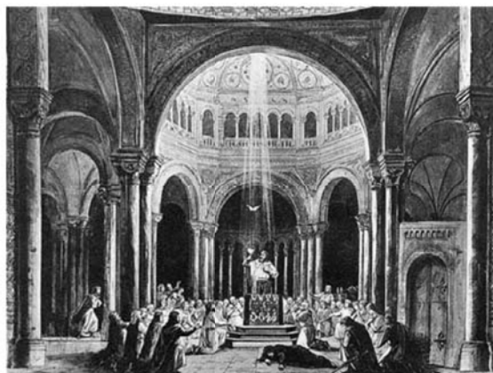
図6 Coronation in Jerusalem as Holy Grail's King

参考文献：Kantorowicz, E., Kaiser Friedrich der Zweite , Stuttgart, 2008