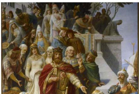
図1 Friedrichs II. zu Palermo(1879, Wislicenus, H.)