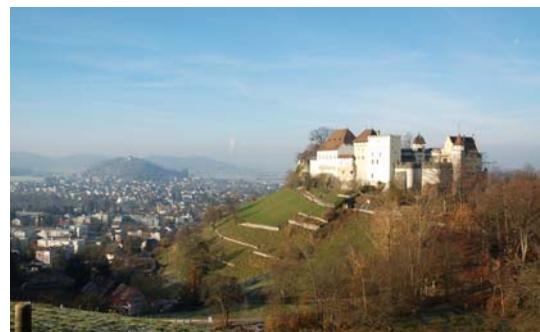
図3 Schloss Lenzburg