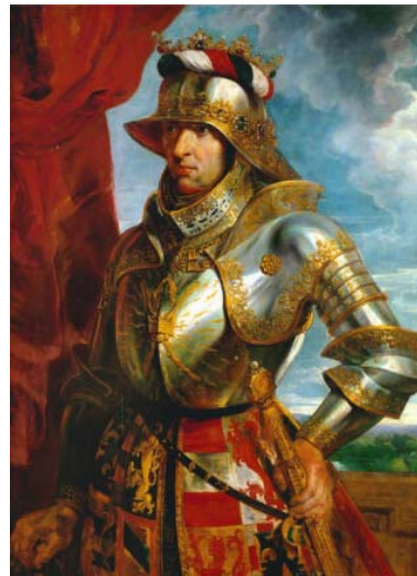
図11 Der letzte Ritter, Maximilian I. (HRR. 1459-1519)