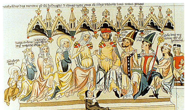
図4 Haus Andechs-Meranien (Herzog)