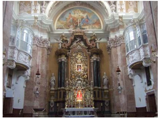
図9 Innsbrucker Dom