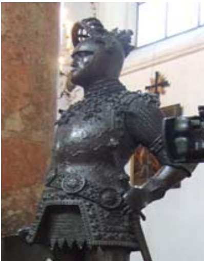
図8 King Arthur, Hofkirche(Innsbruck)