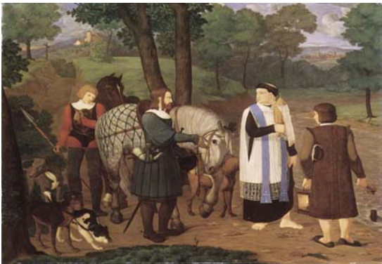
図7 Rudolf und der Priester (Gemälde von Franz Pfaff um 1809)