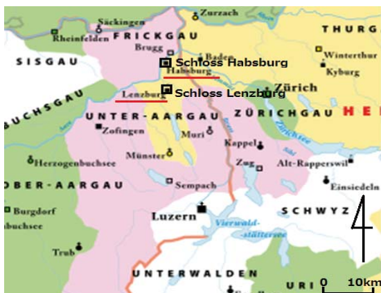
図1 Habsburg-Lenzburg in Swiss:筆者編集

国家や民族、言語、文化が錯綜し、戦争の絶えなかったヨーロッパにおいて、新たな理想を掲げたアンデクス・メラン家が断絶後、ハプスブルク家に託したその精神と統治が今日に継承されていることに及びたい。