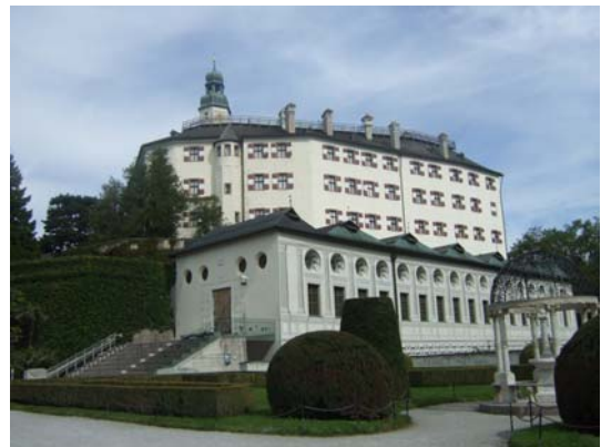
図10 Schloss Ambrace (Innsbruck)