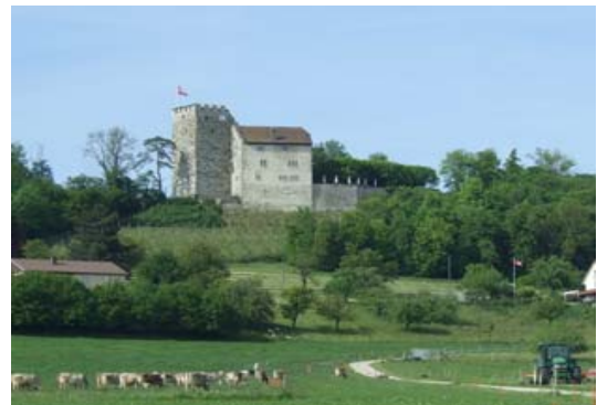
図2 Schloss Habsburg:筆者撮影