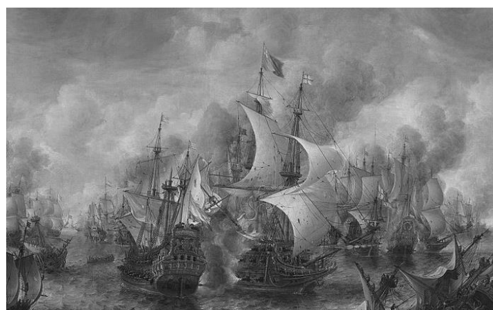
The First Anglo-Dutch War, 1653