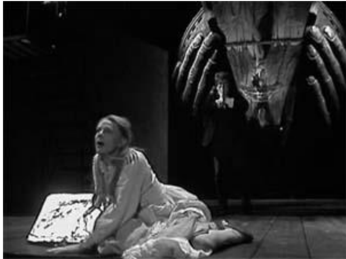
Wagners Holländer at Dresden in 1843(premier), at Bayreuth Festspiele in 1985

本論は、東京大学史料編纂所における特定共同研究「モンズーン文書・イエズス会日本書翰・VOC文書・EIC文書の分野横断的研究」(通称:モンズーン・プロジェクト、松方冬子班)の研究成果を取り入れている。