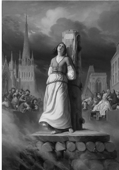
F. Marryat, The Phantom Ship, 1839 -Image- Joan of Arc's Death, by H. Stilke (1843)