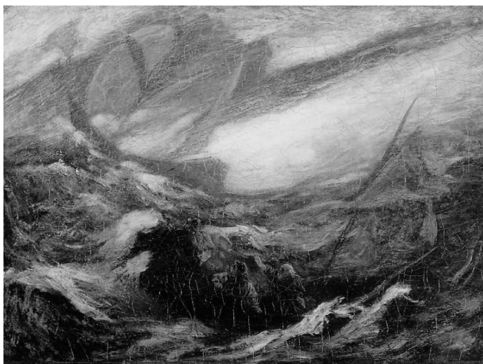
The Flying Dutchman by A.P.Ryder, c.1887