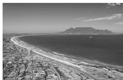
Tablebay at Cape of Good Hope