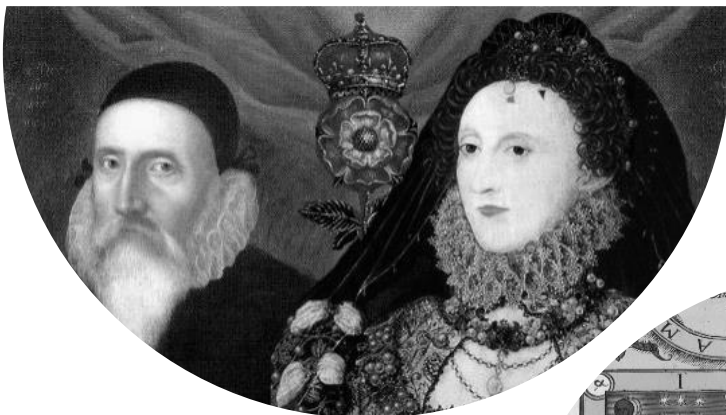
John Dee & Elizabeth I