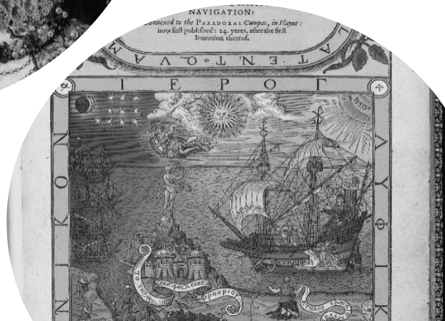
Dee & British(not England) Empire