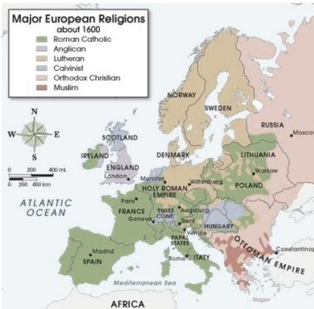
Catholic and Protestants at Europe in 1600