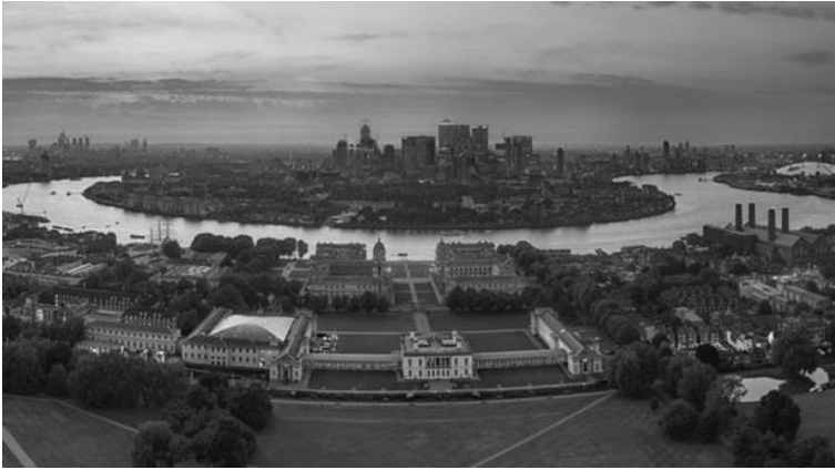
Her Birthplace Greenwich