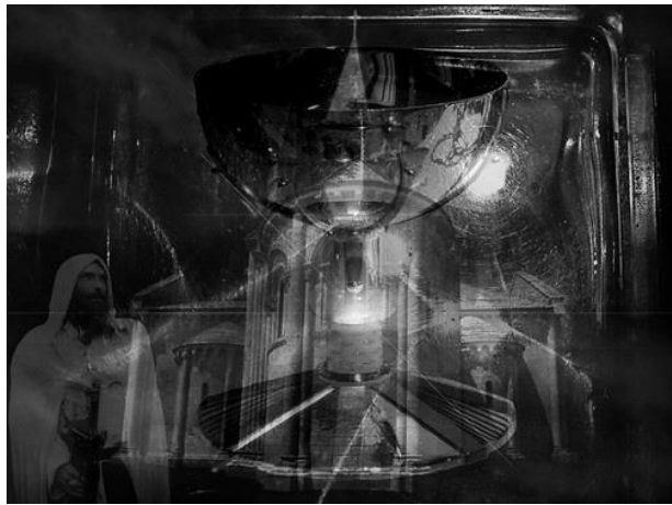
La morte de Arthur and Quest of Holy Grail by Parsifal