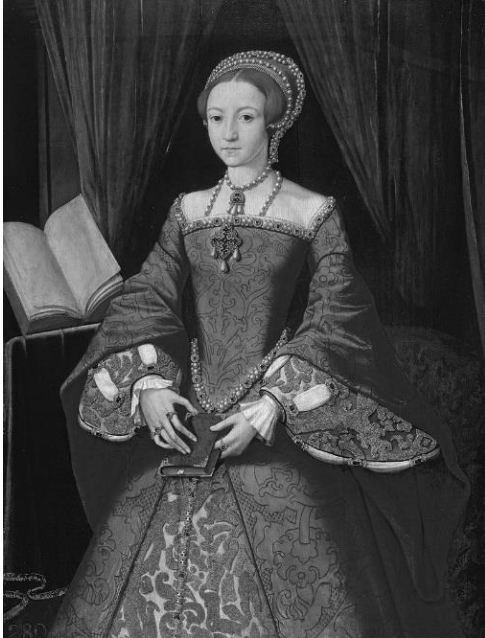
Elizabeth I (c.1546, 1533-58-1603)