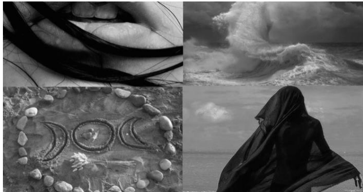
Astrology and Meteorology