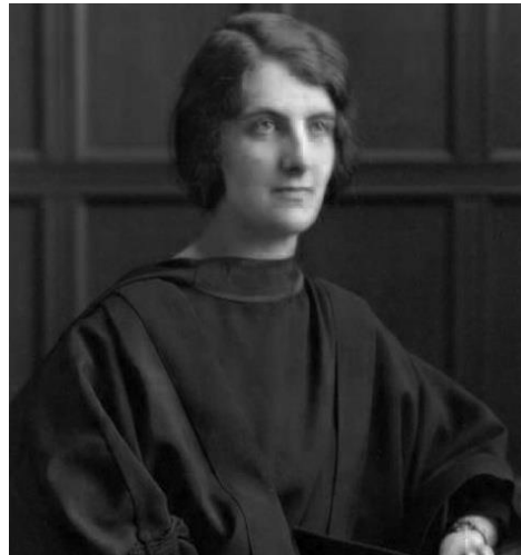
Frances Yates(c.1924, 1889-1991)